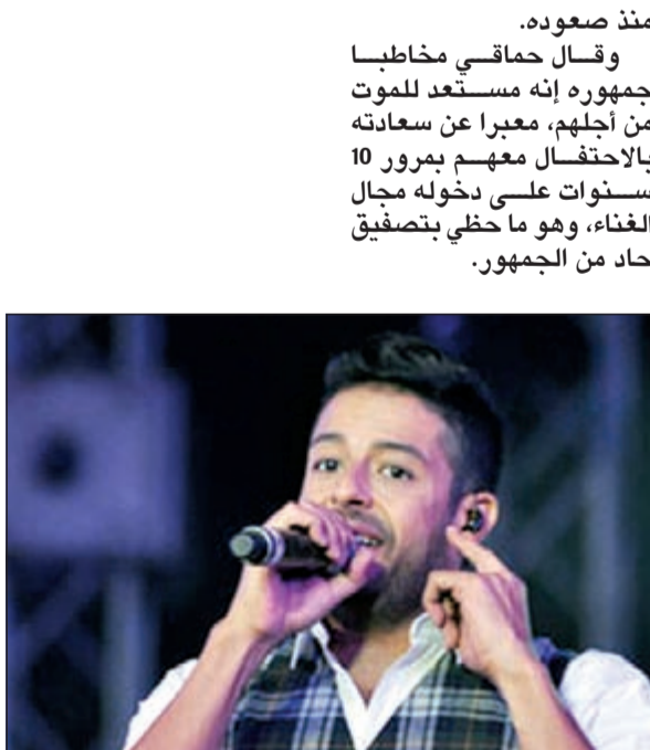
محمد حماقي في الحفل

في حفلة خاصة اقتصر الحضور فيها على أصحاب الدعوات، احتفل الفنان محمد حماقي بمرور 10 سنوات على احترافه الغناء داخل صالة الهوكي باستاد القاهرة الدولي بحضور أكثر من 10 آلاف شخص من حبيه، وتواجد بين الحضور عائلة حماقي والفنان الشاب حسام حبيب ومسؤولو شركة «نجوم ريكورز» التي انضم لها حماقي أخيرا. وارتدى حماقي الملابس نفسها التي ارتداها في كليب «يتضحك»، الذي يعتبر أول كليب عرفه الجمهور من خلاله، وقدم مجموعة من أغانيه على مدار أكثر من 90 دقيقة، فتفاعل الجمهور مع الاغاني، وعرض مقطع فيديو لأحد أعضاء فرقة الموسيقى الذي توفي منذ فترة، وحرص على توجيه الشكر للفرقة التي ساهمت في نجاحه