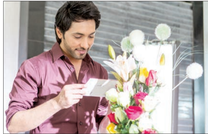
فهد الكبيسي في الكليب

انتهى الفنان القطري فهد الكبيسي من تصوير أولى أغنيات الألبوم الجديد الذي سيصدر خلال الأيام الأولى من العام المقبل 2014، بعدما تعاون به لأول مرة مع المخرج العراقي ياسر الياسري الذي اختار مدينة دبي لتصويرها معتمدا على مجموعة مواقع متعددة انتهى من تنفيذ عملية التصوير على مدار يومين من العمل المتواصل منذ الصباح وحتى الساعات الأخيرة من كل يوم، معتمدا في قصته على عنوان وكلمات الأغنية الجديدة التي اختارها فهد لتصويرها «مزاجي» والتي ستحمل عنوان الألبوم الجديد أيضا الذي سيصدر عن طريق شركة «بلاتينيوم ريكوردينز» التابعة لمجموعة mbc الإعلامية.