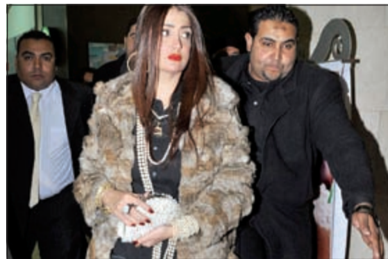
غادة محاطة بالحراس الشخصيين

من مرة داخل القاعة وخلال تلقيها التهاني من الفنانين زملائها. ومن جهتها، أعربت غادة عن سعادتها، حسب موقع «أنا زهرة»، بعرض الفيلم، مؤكدة أنه تجربة جديدة وغريبة، خصوصا أنه يدور حول ثلاث شخصيات فقط. وتمنت أن ينال إعجاب الجمهور، لأنها بذلت مجهودا كبيرا فيه.