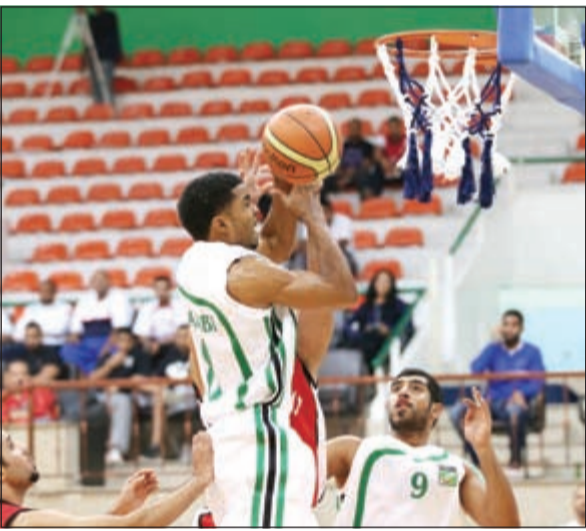
العربي يطمح لتحسين أوضاعه في القسم الثاني