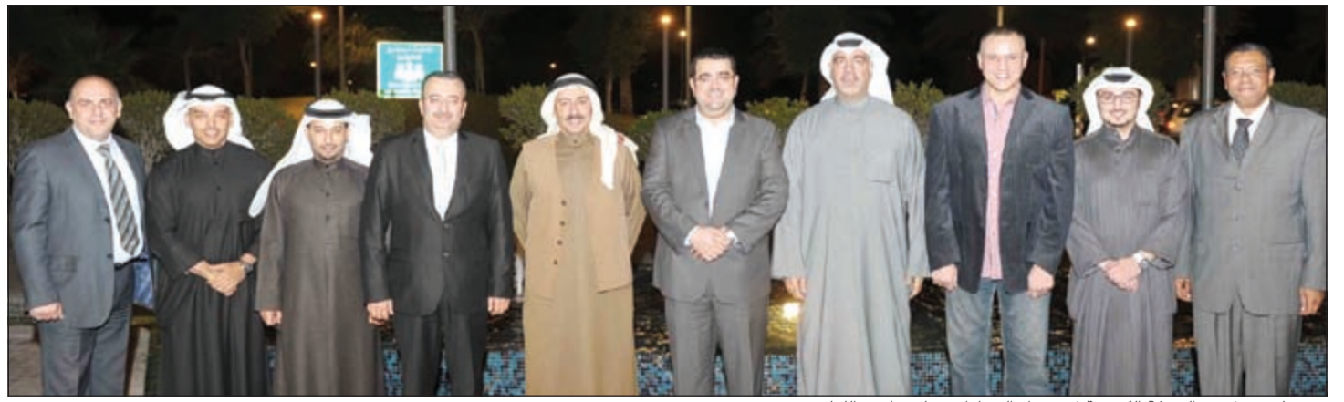
مسؤولو «بيتك» و«الشركة الكويتية لاستيراد السيارات» على هامش اللقاء

لمزيد من المعلومات تفضلوا بزيارة موقعنا أو الإتصال بنا على رقم 2225 5000 www.kmfic.com.kw