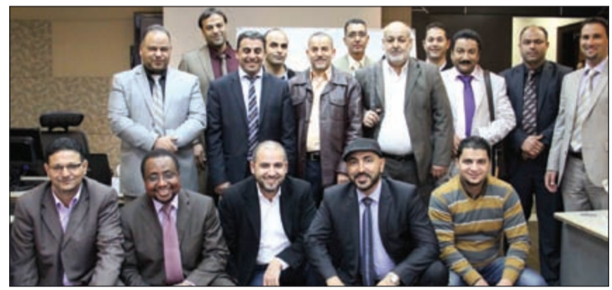
الوفد الليبي خلال زيارة لـ «بيتك»

كما تناول برنامج نظمته إدارة التعليم والتطوير بالتنسيق مع إدارة الرقابة الشرعية، مرجعية عمل هيئات الفتوى والرقابة الشرعية، وتجربة «بيتك» في الرقابة الشرعية، والهيكل الإداري للمكان الشرعي في «بيتك»، ومهامه وأختصاصاته وعلاقة الإدارة التنفيذية بالهيئة الشرعية، وعلاقة إدارة الرقابة والاستشارات الشرعية بالإدارة التنفيذية وإدارات الأعمال في البنك. كما تعرف الوفد على خريطة العقود المطبقة في المصارف الإسلامية وكيفية تطبيق التعامل بالمنتجات المصرفية وفقاً للشرعية الإسلامية.