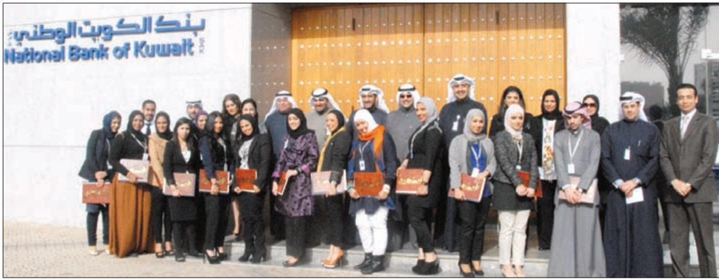
البنك وفر أكثر من 1600 فرصة تدريبية في إطار إستراتيجيته لاستقطاب وتأهيل الكوادر الوطنية