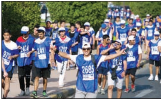
البنك مساهم بارز في إطلاق المبادرات الرياضية والصحية والخيرية على مدى عقود

وأشارت المطر إلى أن العديد من مبادرات البنك الوطني تحولت إلى تقليد سنوي التزاماً بإطلاقها على مدى عقود مضت، على غرار برنامج «الوطني» الذي أُنجز في شهر الخير، الذي يلتزم به منذ أكثر من عقدين من الزمن، وسباق المشي الذي بدأ على إطلاقه منذ 19 عاماً إلى جانب برنامج البيئي الحافل بالأنشطة البيئية والذي بدأ قبل أكثر من 6 سنوات ليكرس موقعه كأول بنك صديق للبيئة في الكويت وليكون سابقاً في هذا المجال على مستوى مؤسسات القطاع الخاص.