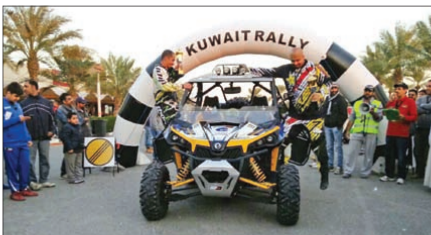
فريق الغانم مارين ORP يحرز المركز الأول

العالم وبالأخص سباق اوكرانيا الدولي ورالي دكار الشهير الذي استمر لمدة 14 يوماً ومسافة 8,500 كم، في أصعب الظروف الجغرافية والمناخية. وجدير بالذكر أن شركة الغانم مارين هي الوكيل المعتمد والحصري لمنتجات BRP بالكويت والتي تتبني دائماً تشجيع الشباب الكويتي للمشاركة في المسابقات الرياضية من خلال منتجات أنواعها أو منتجات Sea-Doo المائية، وتحرص الشركة على توفير احتياجات عشاق تلك الرياضات من خلال افرع ومراكز البيع ومنطقة المعتمدة بمنطقة البري ومنطقة الفحيحيل. وعن شركة BRP فهي الشركة الرائدة عالمياً في تصميم وتصنيع المنتجات الترفيهية والمركبات تأسست منذ 80 عاماً ويتم توزيع منتجات BRP على أكثر من 100 دولة من خلال أكثر من 4200 وكيل وموزع معتمد.