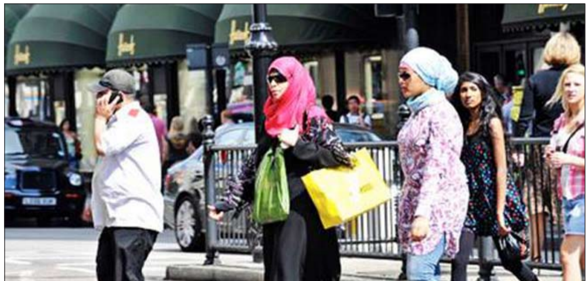
لندن تجذب نساء العرب في عطلة الكريسماس