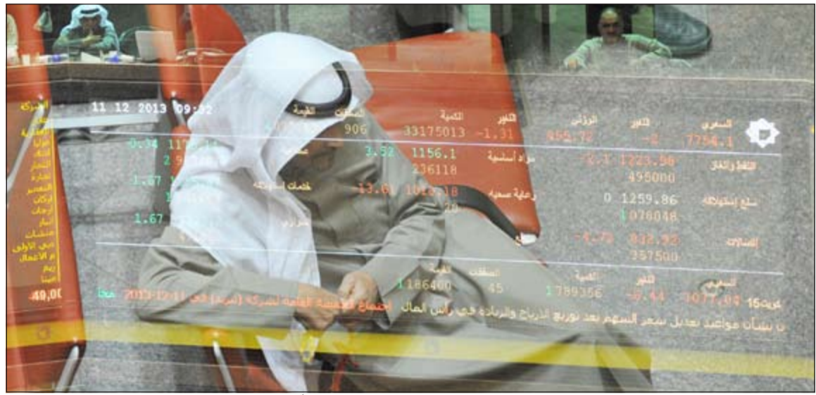
تراجع السوق انعكس سلبا على نفسية المتداولين خلال 2013 .. وقد يكون القطاع العقاري الملاذ الآمن في 2014 (هاني عبدالله)