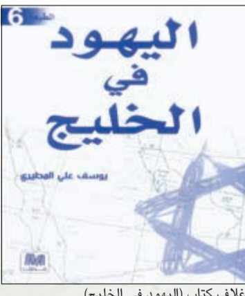
غلاف كتاب (اليهود في الخليج)