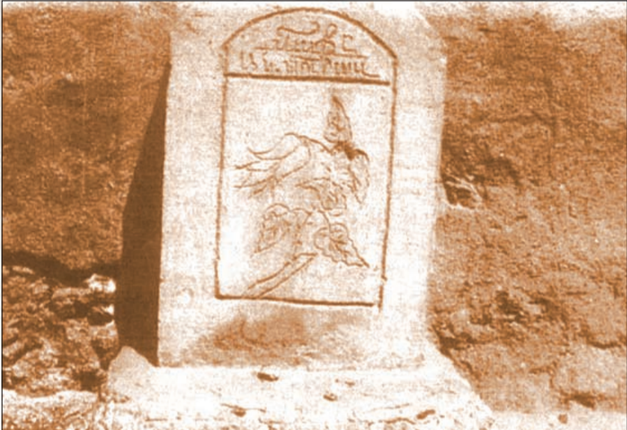
قبر يهودي في منطقة شرق