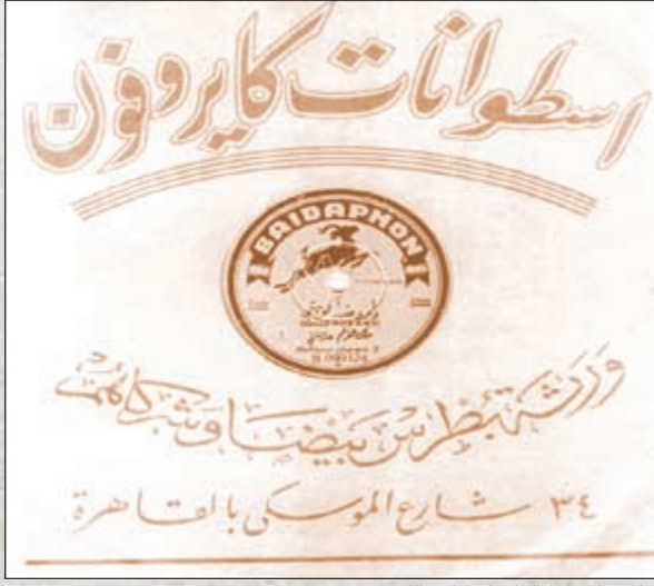
غلاف اسطوانة للفنان داود الكويتي