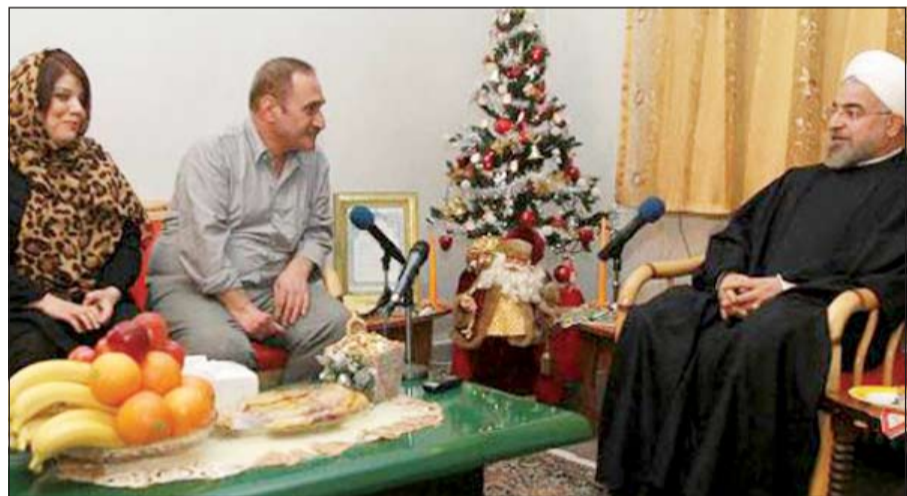
الرئيس الإيراني حسن روحاني إلى جانب شجرة الميلاد خلال عشاء مع عائلة مسيحية إيرانية

«العربية.نت»: أطل الرئيس الإيراني حسن روحاني فجر امس، بصورة نادرة ظهر فيها إلى جانب شجرة عيد الميلاد، مع تغريدة على حسابه في «تويتر» الذي يغرد فيه بالإنجليزية والفارسية لمتابعين عددهم أكثر من 137 ألفاً من المغردين.