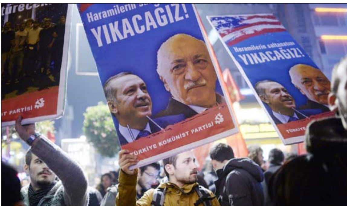
محتجون اترك يرفعون صوراً لاردوغان وغولر ويهتفون بإسقاطهما خلال مظاهرات باسطنبول امس الاول

كما اقال أردوغان، وزير شؤون الاقتصاد الأوروبي السابق أغمين باغش لصلوغة في اتهامات بتقاضي 150 مليون دولار كرشى. ويعد ستة أشهر فقط من التظاهرات غير المسبوقة التي تحدث سلطته في يونيو الماضي وجد أردوغان الذي يحكم تركيا بلا شريك منذ 11 عاما، نفسه امام عاصفة سياسية عنيفة.