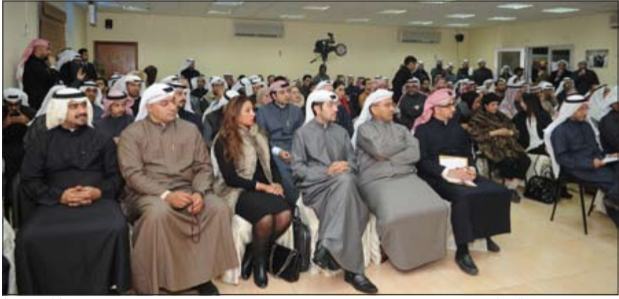
حضور ضخم من الشباب (تاسم باشا)