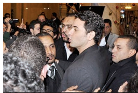
أحمد عز محاطا بالمعجبين

الشهيرة «غمزات»، وقد اتفق دياب مع منتج البوماته نصر محروس على عدد الأغاني التي سيغنيها وأسمائها، التي ذلك ويعد أن سبق وأكد للمقربين منه أنه سيكتفي فقط بالغناء في الحفلة المزمع إقامتها 28 الجاري، احتفالا بمرور عشر سنوات على مشواره الغنائي، عاد المطرب محمد حماقي ليتعاقد على حفلة رأس السنة، التي يقيمها في فندق كونراد السلام، ويبدو أن