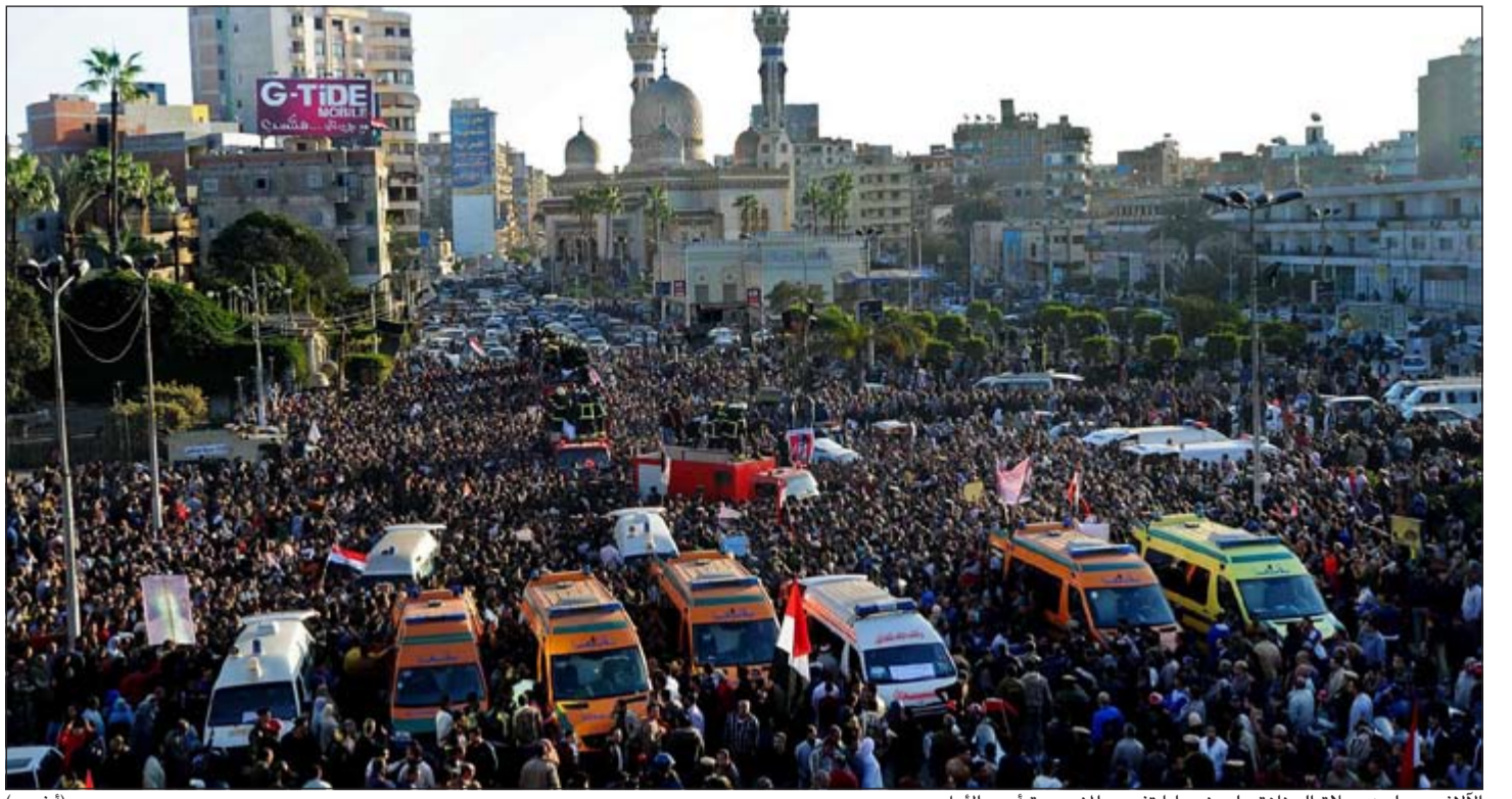
الآلاف يصلون صلاة الجنازة على ضحايا تفجير المنصورة أمس الأول

وقام مدير شرطة المطار اللواء علاء على وجميع القيادات الأمنية من كل الجهات أمس الأول بعمل جولة لمتابعة الإجراءات الأمنية، كما تم نشر الكماثن المرورية من جميع الاتجاهات المؤدية إلى الصالات والمبانى