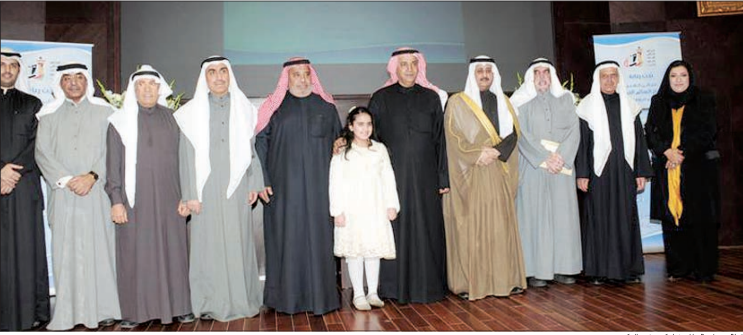
لقطة جماعية للمشاركين في التكريم