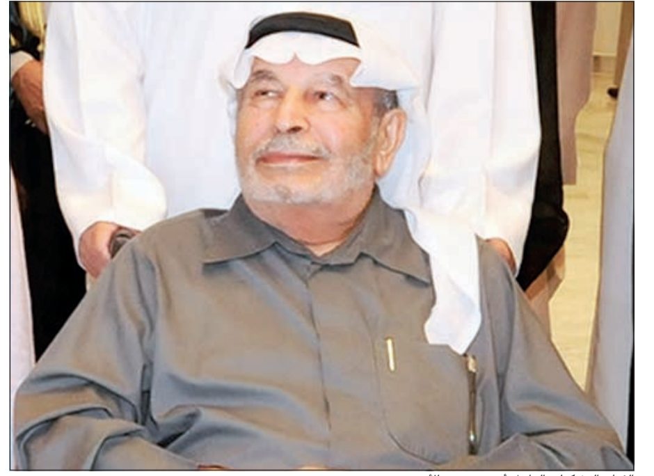
الفنان التشكيلي الراحل أيوب حسين الأيوب

نظمها المجلس الوطني للثقافة والفنون وبرعاية وزير الإعلام