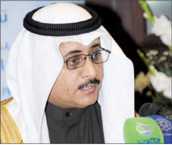
الأمين المساعد بالمجلس الوطني د. بدر الدويش