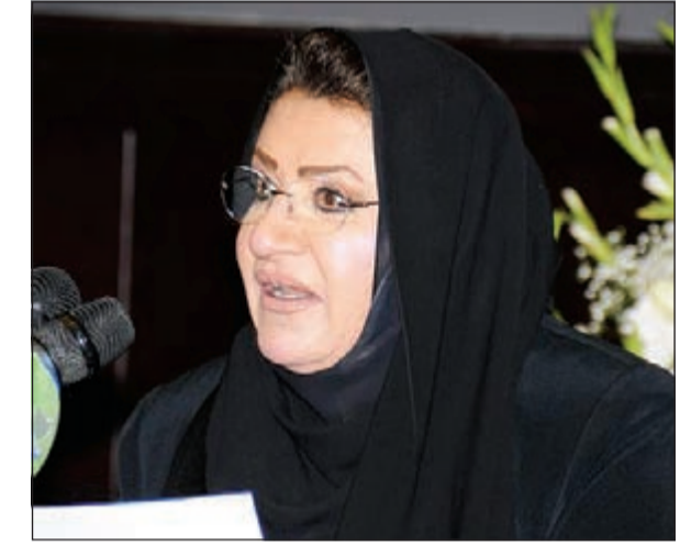
د. كافيّة رمضان

توثيقية، بل كانت ريشة الراحل وقلمه يوثقان كل سكة وصهيد ومدرسة ومسجد أو بيت أو باب دخل منه أو وقف بجانبه. من جانبه قال د. عبدالله الحداد في كلمة القاها نيابة عن الفنانين التشكيليين: سيرة حياة الفنان الراحل أيوب حسين الذي ولد بحي القناعات في منطقة شرق الكويت القديمة عام 1930 وتلقى تعليمه بالمدرسة المباركية ومن ثم عمل بقطاع التعليم مدرسا للرسم كانت حافلة، فقد أصبح فنانا تشكيليا ورسم بيئة الكويت القديمة التي لم ينلها التطور والعمران. وفي نهاية حفل التابين قدم المجلس الوطني للثقافة والفنون والآداب درعا تكريمية لعائلة الفنان الراحل أيوب حسين الذي رحل 15 نوفمبر الماضي، وذلك تكريما لدوره في إثراء الفن والآداب الكويتيين.