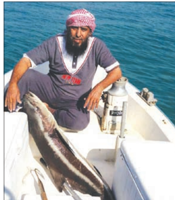
سكن شي خيال