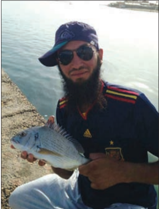
شعوم الأسياف مكنم