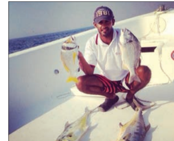
صيد الجنوب شي ثاني

المحاديق اليوم أصبحت بصراحة شديدة من الأسماك والواحد منا يذهب من الصباح الباكر ولا يرجع حتى غروب الشمس ولم يصطد شيئاً وإذا رب العالين وفقه يمكن انه يرجع بسمكة أو ثلاث وهذا الشيء طبعاً على كبر بحرننا يعتبر شيئاً قليلاً جداً، والأسباب في قلة الصيد هي التلوث والقراقرير وكثرة الحدائق، نعم هذه الأشياء ساهمت وبشكل كبير في قلة الصيد والسمكة، وأنا من خلال خبرتي المتواضعة وجدت أن بعض الأماكن مازالت كريمة بعطائتها ولا تبخل على كل من يأتي إليها، وهذه الأماكن هي الدفان التي تنعم بأسماك الشعوم والنوبيي والهوام وير اغظي التي فيها أسماك