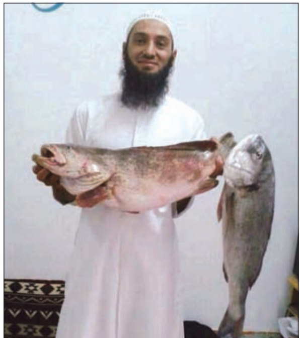
هامور وسببتي الحيشان