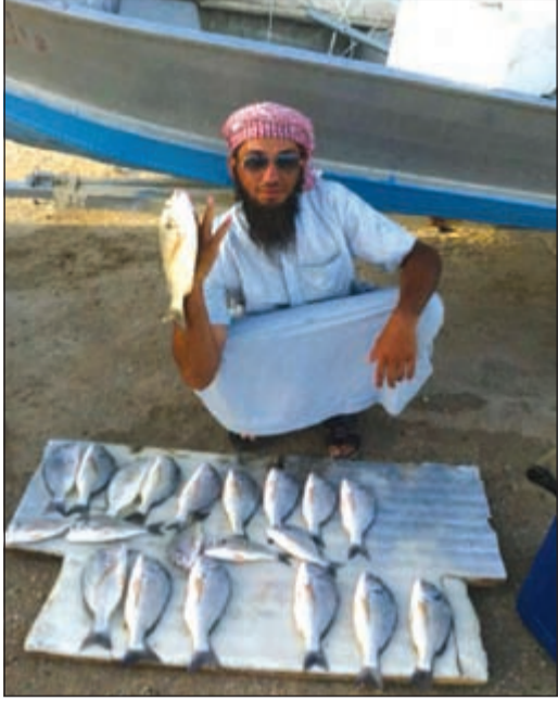
صيدي شعوم دالما

«بحري» صفحة تستقبلكم كل أربعاء بكل ما يعنى بالبحر وهواية الحدائق ● اسبوعياً نسلط الضوء على هذه الهواية، ونستقبل مشاركاتكم وصوركم وآراءكم. للتواصل معنا عبر هذه الصفحة أرسلوا تعليقاتكم على الايميل: bahri@alanba.com.kw