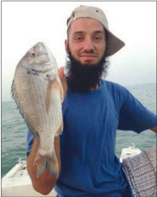
وهذا الشعوم المطلوب