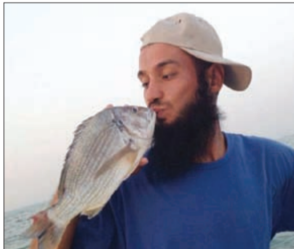
قبلة لأحلى شعوم

هل صادفت يوما من الأيام انك اصطدت سمكة والتقطتها