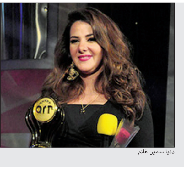
دنيا سمير غانم