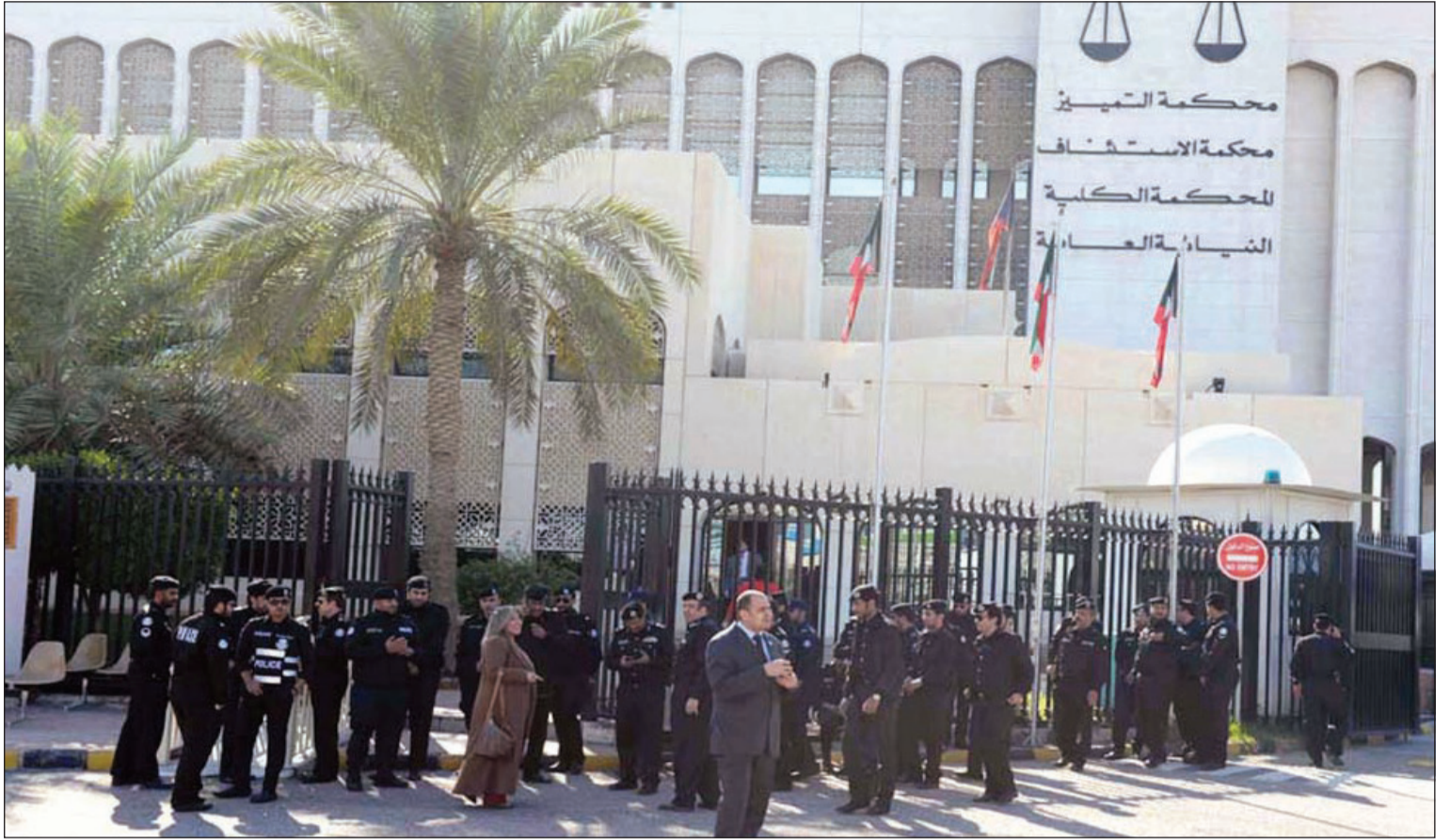
رجال الأمن يتواجدون أمام بوابة قصر العدل قبل صدور الحكم