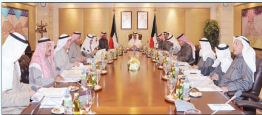
سمو الشيخ جابر المبارك ومصطفى الشمالي والشيخ سالم عبدالعزيز خلال اجتماع المجلس الأعلى للبترول

تحقيق أرباح بقيمة 981 مليون دينار. وقالت المصادر إن هناك حالة من الاستياء انتابت الأعضاء في المجلس لتأخر عقد الاجتماعات الدورية، حيث أن المجلس لم يجتمع منذ أكثر من 6 أشهر والأمور التي تعرض عليه متأخرة.