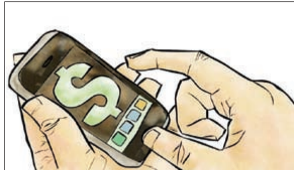
هل الكويت ستنتج في تطبيق منظومة متطورة لتحويل الأموال؟

ونكر المصدر أن الكويت ستستفيد على موقعها الريادي كأكبر مورد لوقود الطائرات إلى أوروبا بعد القرار الذي اتخذ الأسبوع الماضي بتعليق فرض الرسوم على واردات وقود الطائرات، مؤكداً على أن مؤسسة البترول الكويتية ومن خلال ذراعها في أوروبا شركة البترول العالمية تمكنت من زيادة صادراتها إلى أوروبا بنسبة 57٪، حيث بلغت الواردات في أواخر عام 2012 حوالي 1,77 ألف طن متري، وبين أن مؤسسة البترول تحرص للحفاظ على دورها الريادي كأكبر مورد لوقود الطائرات لأوروبا من خلال خلق منظومة متكاملة لاستخراج أعلى قيمة مضافة