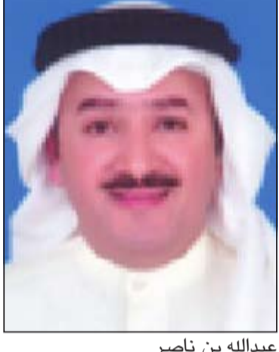
عبدالله بن ناصر