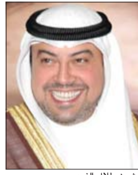
الشيخ طلال الفهد