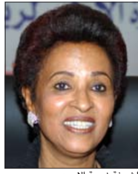
الشيخة نعيمة الاحمد