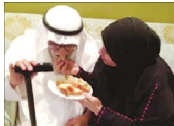
الصورة الفائزة بالمركز الأول في مسابقة التصوير الفوتوغرافي لشيخة صالح المعنوق