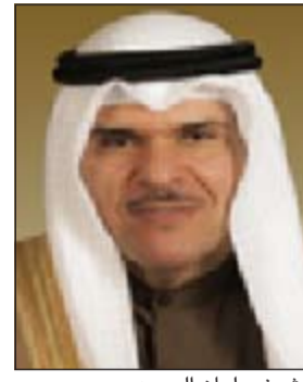
الشيخ سلمان الحمود