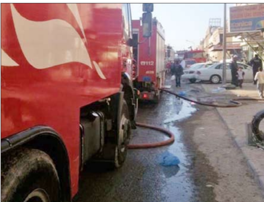
عربات الإطفاء تحيط بالمنزل

وقال مصدر امني إن خمسة مراكز إطفاء شاركت في إخماد حريق اندلع بمنزل عربي قطعة 2 وتحديدًا في شارع 170 ظهر أمس ويتكون الحريق الذي ابتلع دورين كان بهما خشاب وأصباغ وكانت مراكز الإطفاء المشاركة هي: العارضية والفروانية والمواد الخطرة والسالمية والإسناد واستغرق إطفاء الحريق نحو ساعتين ولم يخلف الحريق أي إصابات وجار التحقيق في الواقعة بمعرفة الأسباب التي أدت إلى الحريق.