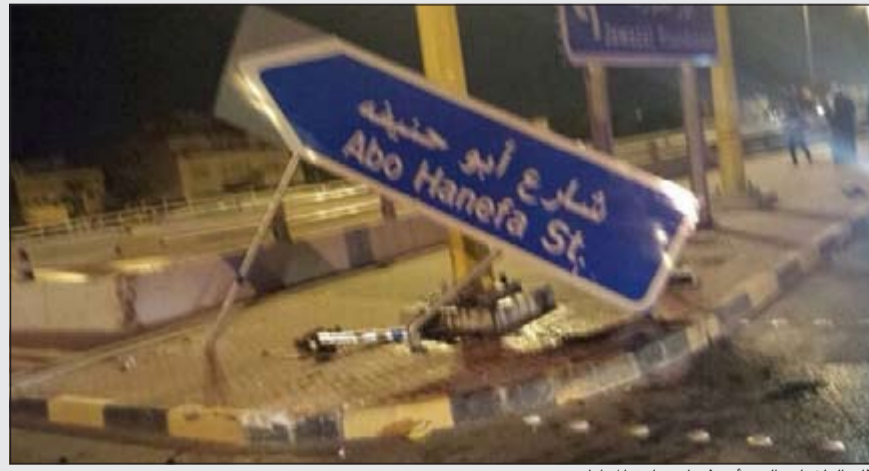
آثار التلغيات التي أحدثتها سيارة المواطن