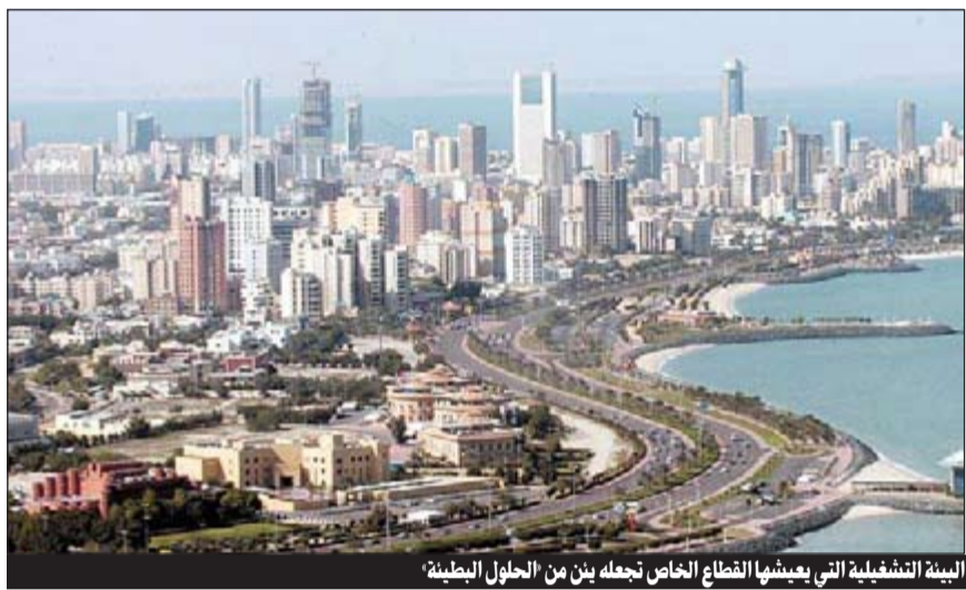
البيئة التنافسية التي يعيشها القطاع الخاص تجعله يئن من الحلول البديلة

في تقارير صندوق النقد الدولي حول الكويت.