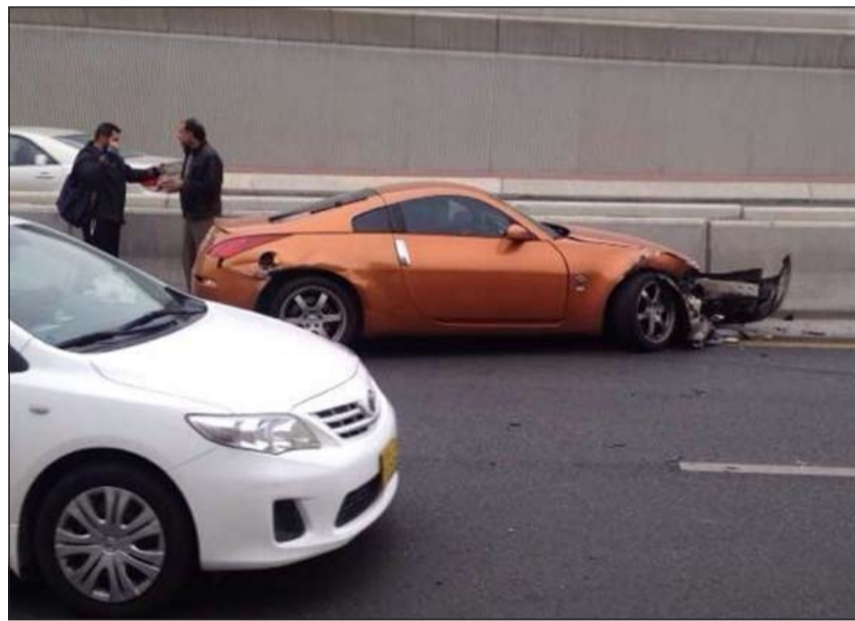
الحادث تسبب في إغلاق نفق الخطابي مؤقتاً