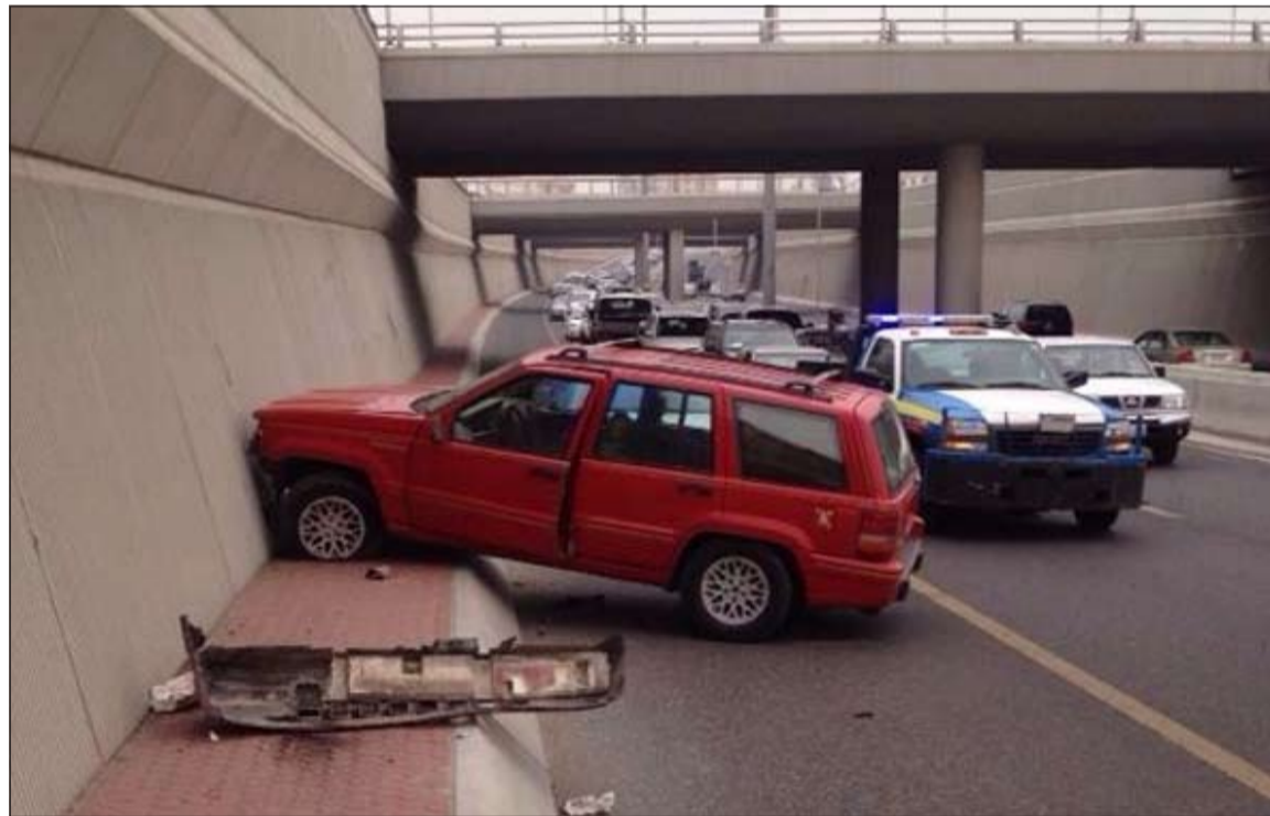
دوريات المرور في موقع الحادث

شهد طريق الخطابي حادث تصادم ثلاثي تعامل معه رجال دوريات مرور حولي فيما نقل احد قائدي المركبات الثلاثة الى المستشفى ووصفت حالته بالمستقرة.