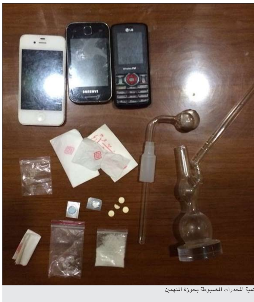
كمية المخدرات المضبوطة بحوزة المتهمين

استنفر رجال امن محافظة الاحمدي بعد ورود بلاغ عن وجود جثة لقط داخل احد فصول مدرسة