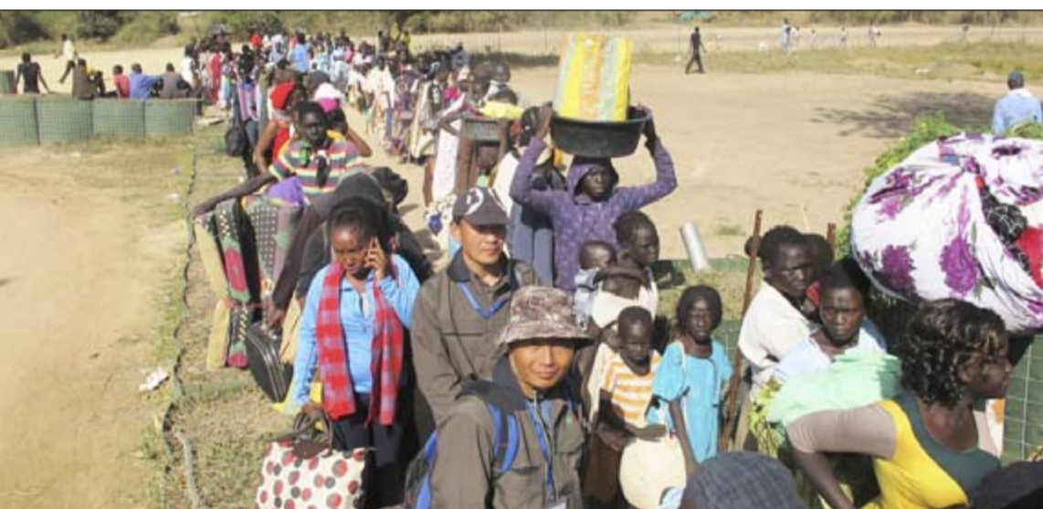
اللاجئون من جنوب السودان يتدفقون على احد معسكرات الامم المتحدة بمدينة بور امس

قبيلته «النوير» في التوترات الأخيرة بالبلاد. ونكرت «سودان تريبيون» بالعربية أن سلفاكير ميارديت أمر قواته في جوبا بالانسحاب إلى ثكناتها، قبل أن يعرض تحت ضغط من المجتمع الدولي الحوار مع مشار، الذي سبق أن اتهمه بتبدير محاولة للسيطرة على الحكم في البلاد المولودة حديثا. في هذه الأثناء، تنجه مجموعة من وزراء خارجية كل من كينيا واوغندا واثيوبيا وجيبوتي، إلى جنوب السودان