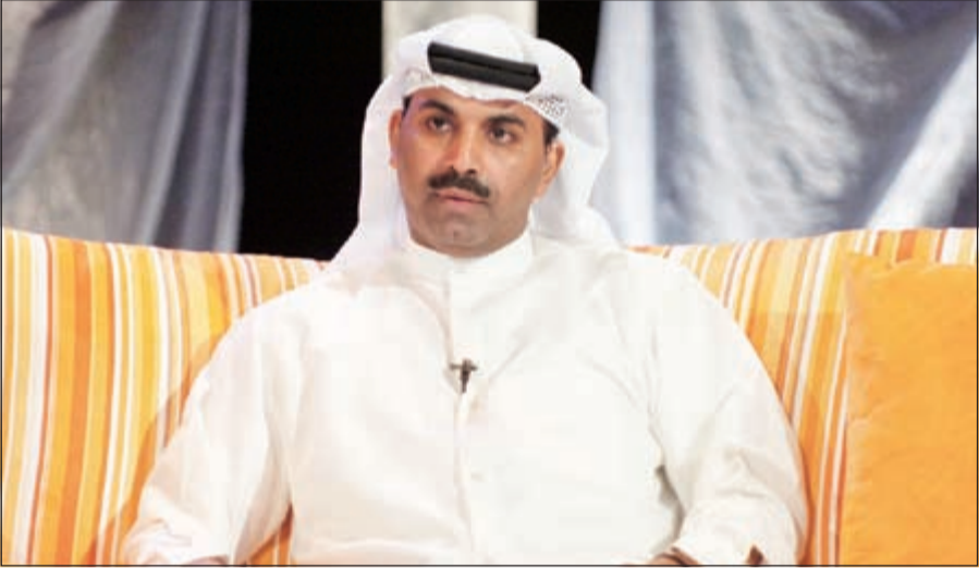
النجم طارق العلي

الشباب العاشق للمسرح، فكان بالفعل نجم المهرجان رغم ارتباطاته العديدة الفنية والأسرية.. عسكنا على القوة يا بومحمد وإن شاء الله يحسون الباجي من الفنانين النجوم بالشباب.