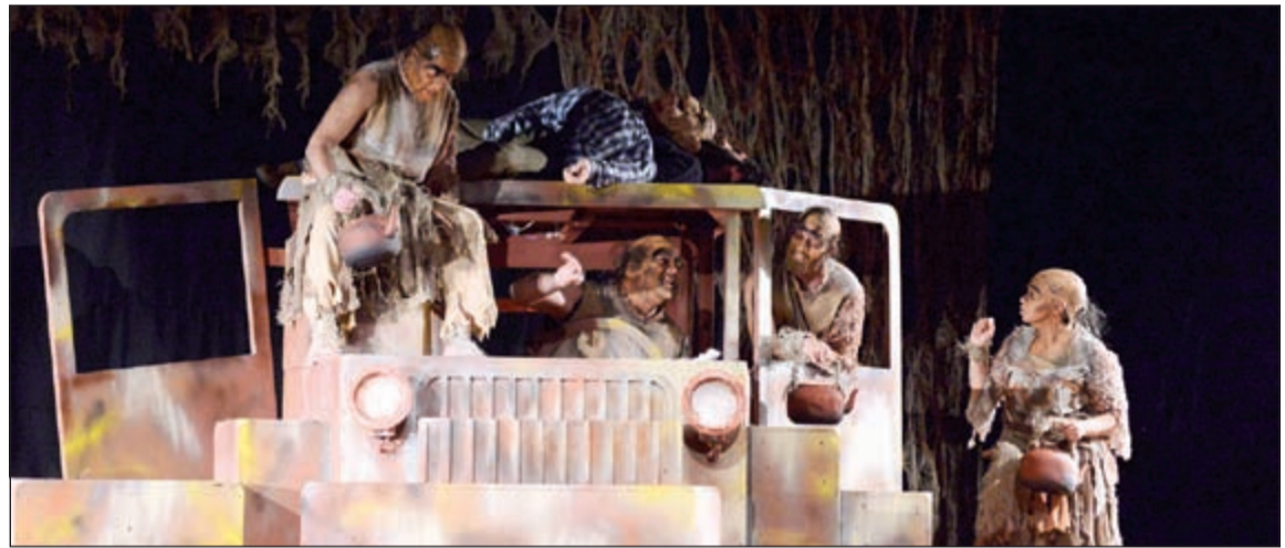
مشهد من «راديكاليا»