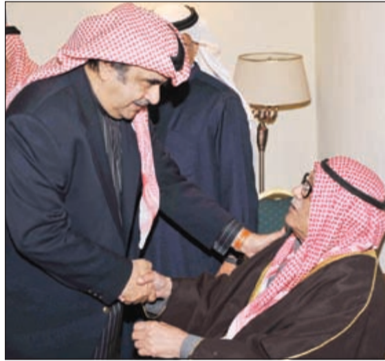
حديث ودي بن الخبير الفلكي د. صالح العجيري والفنان القدير حسين عبدالرضا