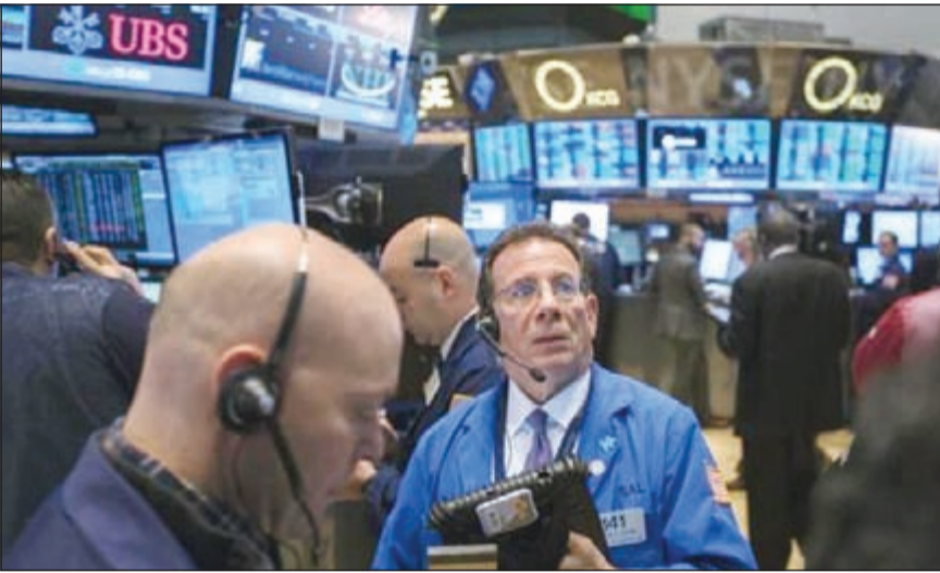
لحظة ترقب لقرار مجلس الاحتياطي الفيدرالي لتقليص التيسير الكمي