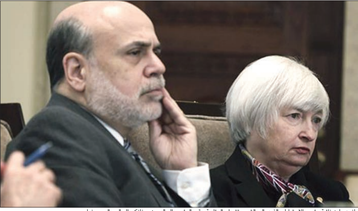
جانيت يلين نائبة رئيس الاحتياطي الفيدرالي التي ستتسلم الرئاسة عقب الرئيس الحالي بن برنانكي الجالس إلى يمينها