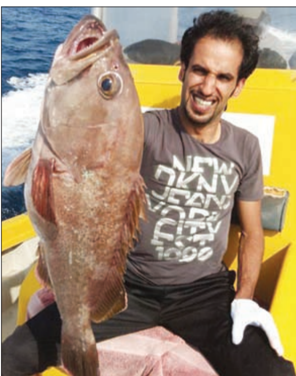
محادق عمان ممتازة

هل جربت تصطاد بدول الخليج؟ ● نعم لقد فكرت وجربت وأكثر الدول التي اصطلت بها وأعجبني صيدها بصراحة هي عُمان وتحديداً بجزيرة مصيرة ورأس مسندم وخصب هذه المناطق تحتوي على أسماك من الأحجام الخيالية التي تبهر أي حداث وفيها صيد خيالي ليس له وصف بصراحة، وأيضا قمت بتسخيظ التوتة بمسقط وأيضا حدقت بالإمارات بدبي والمملكة العربية السعودية بمنطقة السفانية حق صيد السبيطي على الليال.