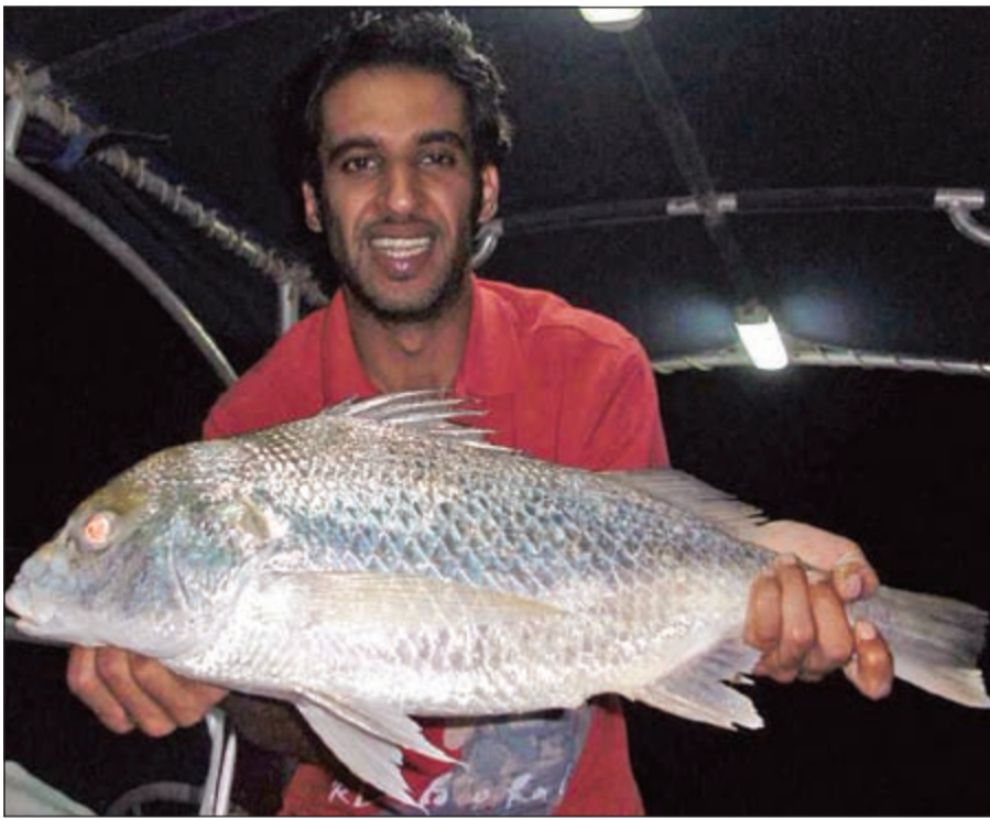
ياعيني على النقرور

هي رأس الأفعي فتمتئ انقطع الرأس انتهت المشكلة، وأيضا التلوث الذي أصبح يحاصرنا من كل مكان اذهب إلى الشمال تلوث اذهب إلى الجنوب لا يمكنك التعليق، فالسؤال هنا فماذا نحن فاعلون؟ الجواب لا شيء هذا حالنا مع المسؤولين نحن نسال وينفس الوقت نجواب لأنه لا يوجد احد يرد علينا وأيضا قلة المسنات هذه المشكلة أصبحت تسيطر على اغلب فكر الحداقة وقتلتها يوم عن يوم تسبب مشاكل بين الحداقة على المسنات بسبب الازدحام الحاصل، وارتفاع المراسي أصبح شيئا مخيفا فإين يذهب صاحب الطراد بطراد؟ لا اعرف وأيضا ما تقوم به العمالة الوافدة من صيد الشريب وبيعه حتى وصل سعر 100 شريب في فصل الشتاء إلى 7 دنانير فأين المسؤولون عن هؤلاء؟