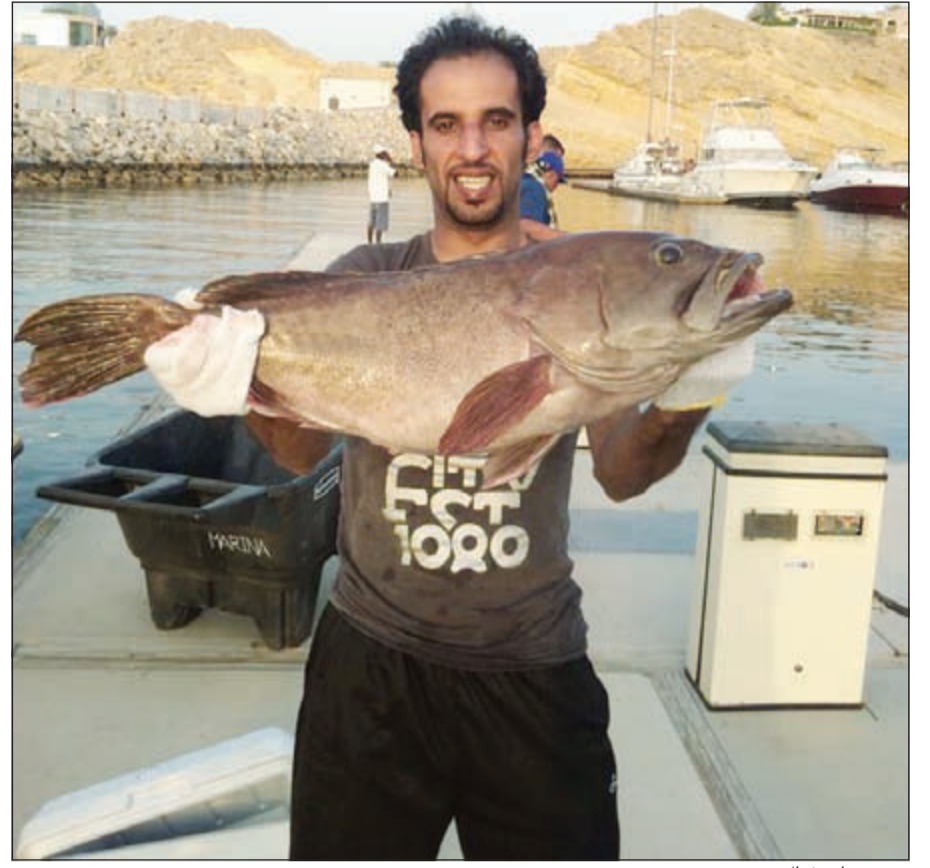
صيد عمان خيال