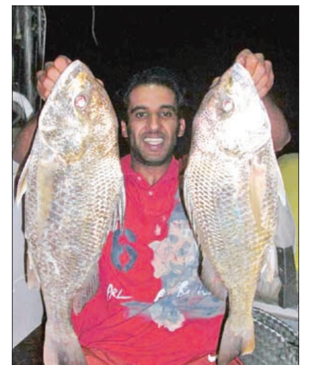
نقارير على كيف كيفك