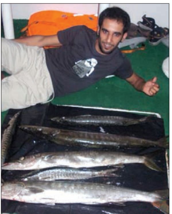
صيد متنوع بإحدى الرحلات

● بحرنا اليوم أصبح شبه ناشف وأغلب الأماكن التي كانت تمتاز بالصيد الوفير والحضور الطيب لجميع الأسماك لم يعد لها ذكر بسبب الدمار الذي اعتمده البعض ولا يهيم سوى الريح المادي ومع كل الدمار الحاصل إلا ان بحرنا يبقى قويا لا يهيم