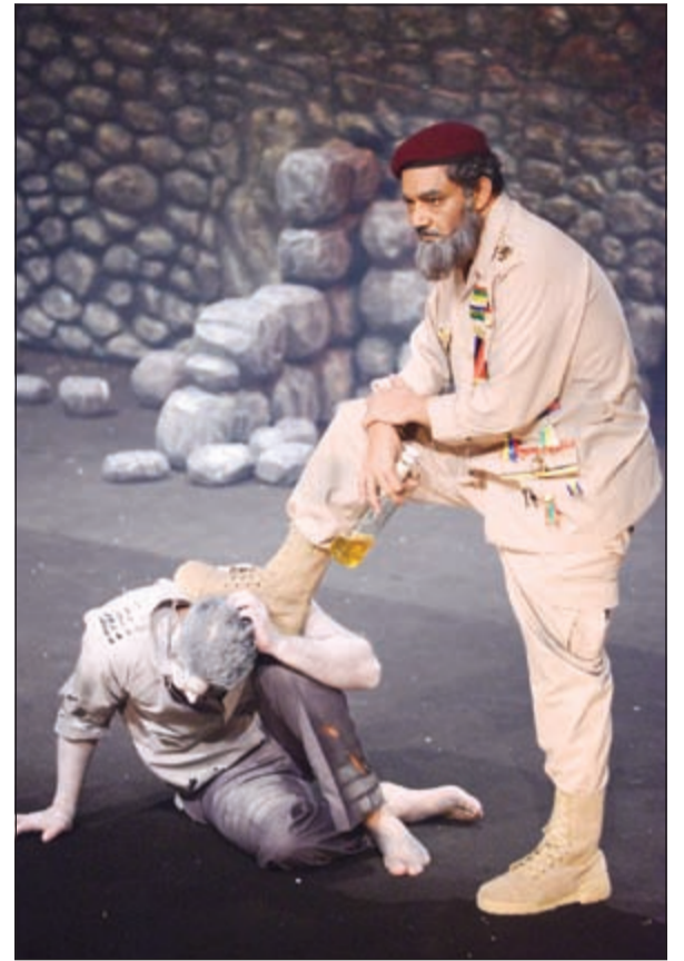
جمال الردهان في المسرحية