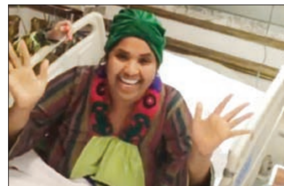
ها الشعبية أثناء استقبالها أحلام

الملكة... خيافة الناس اتخاف منه»، كما أثار التساؤلات، حسب موقع «دنيا الوطن»: «لماذا لم تسافر بطائرتها الخاصة». وفي سياق مختلف، تلقت الفنانة هي الشعبي مجموعة من التهاني بعد