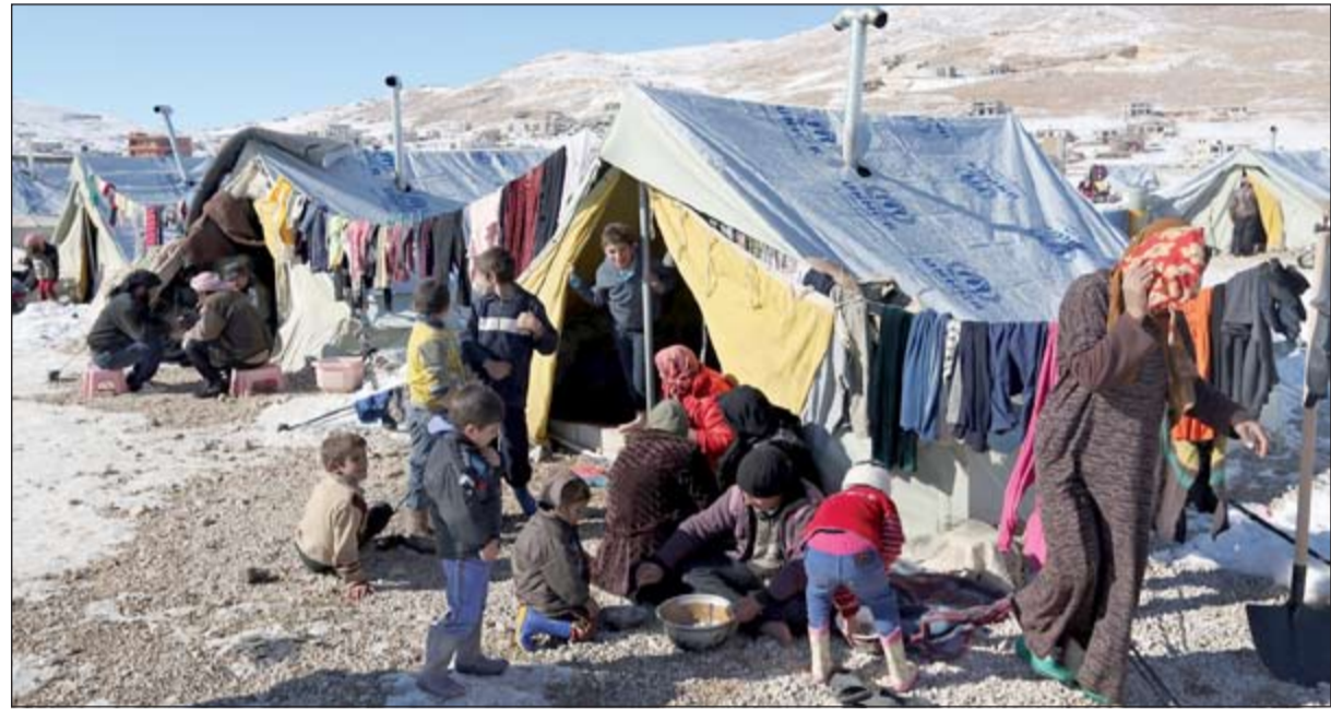
لاجئون سوريون يتناولون الطعام في إحدى الخيام في عرسال اللبنانية وتبدو آثار الثلوج التي هطلت الأسبوع الماضي

لمصلحة الخطة الإقليمية للمفوضية العليا للاجئين لمساعدة اللاجئين السوريين في الدول المجاورة والمجتمعات المضيفة. وتعتبر الحملة التي أطلقتها وكالات تابعة للأمم المتحدة نداء إنساني من أجل حالة طوارئ إغاثية واحدة، حيث يشارك في برنامج المساعدة الدولية لسورية حوالي 108 وكالات دولية تضاف إليها منظمة الهجرة الدولية وعدد من المنظمات غير الحكومية الوطنية والدولية. وتشكل الأزمة السورية أكبر تحدٍ للأمم المتحدة، وتمثل المناشدة من أجل سورية نصف خطة التمويل الإجمالية البالغة 12,9 مليار دولار لمساعدة 52 مليون شخص في دوله والتي أطلقتها أمس أموس في جنيف. وقالت الأمم المتحدة عن الأزمة السورية «عدد النازحين واللاجئين المتزايد يولد حاجات أكبر في كل القطاعات ويضغط على طاقات الدول المجاورة