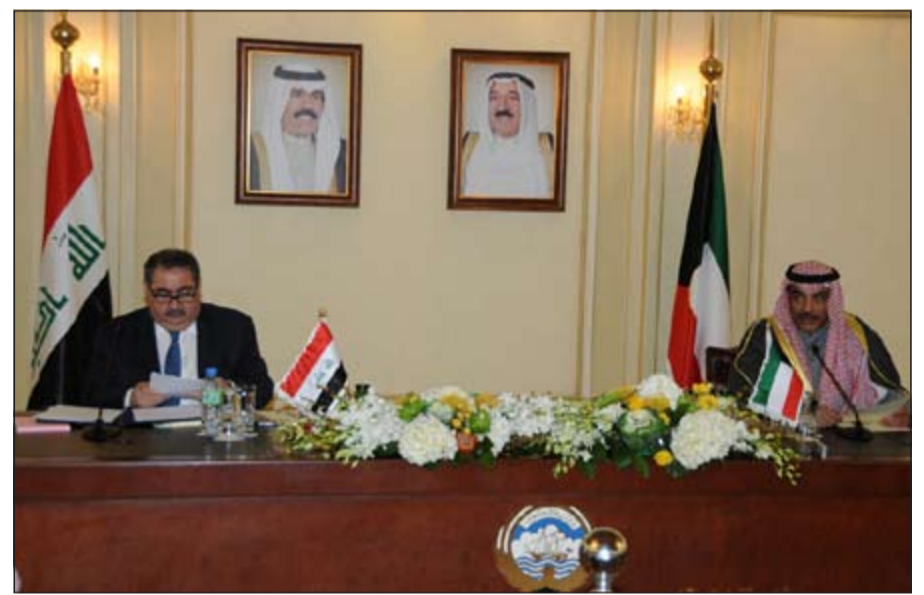
وزير الخارجية الشيخ صباح الخالد ونظيره العراقي هوشيار زيباري خلال المؤتمر الصحافي

«السوق العراقية واعدة ومتمكنة»، مشدداً على انه يوجد في العراق كثير من المناطق الآمنة والتي يعمل فيها آلاف العمال وأن بلاده ليست ساحة حرب بالرغم مما تسمعون في وسائل الإعلام من تفجيرات واخبار أمنية سيئة. مؤكداً ان الفرض المتاحة مفيدة جداً للمستثمرين الكويتيين. وعن تصريح رئيس الوزراء نوري المالكي بوجود محاولات لعزل العراق عن محيطه العربي رأى زيباري انه كانت هناك محاولات ولكنها فشلت بقوة العراق، مشيراً الى ان في بلاده 16 سفارة دائمة ومقيمة في بغداد وعلاقات العراق مع غالبية الدول العربية علاقات اخوية ومتطورة، مضيفاً ان «العراق جزء من المحيط العربي من خلال بعدا الدولي والإقليمي تعيش مع الأشقاء والإخوان في مودة واحترام وهذا النهج هو الذي حدده دستور العراق الجامع لكل».