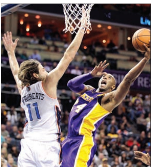
محاولة من كوبي براينت للتسجيل في سلة بولكانس

استعاد كوبي براينت بريقه بعد معاناة من الإصابة وقاد فريقه لوس أنجلوس ليكرز إلى الفوز على تشارلوت بوبكانس 88-85 أول من أمس ضمن السدوري الأمريكي للمحترفين في كرة السلة. وكان براينت يخوض مباراته الرابعة منذ عودته من إصابته بوتر أخيل في إبريل الماضي، وخسر ليكرز المباريات الثلاث الأولى قبل أن يرفع عدد انتصاراته إلى 11 في 23 مباراة في المركز الرابع لمجموعة الهادئ. وحقق لوس أنجلوس ليكرز متصدر المجموعة ذاتها فوزا متصدرا عشرا وكان على حساب واشنطن ويزاردز 113-97. وقاد ليبرون جيمس ودواين وايد وكريس بوش ميامي هيت حامل اللقب إلى الفوز على كليفلاند كافالييرز 114-107.