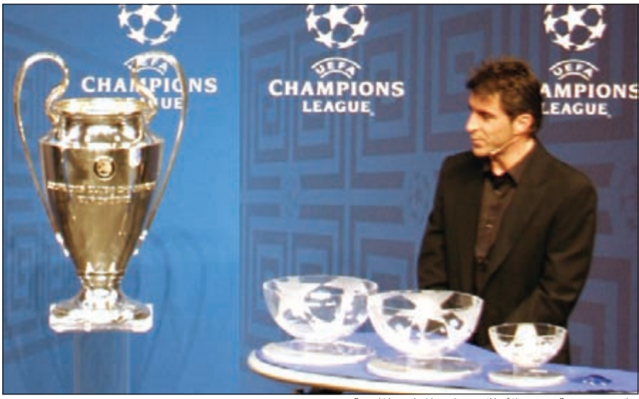
جانج من قرعة دوري الأبطال في أحد المواسم الماضية