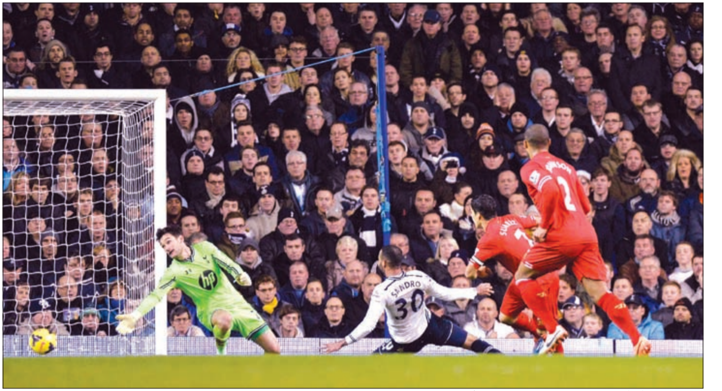
لويس سواريز تائق أمام توتنهام وسجل هدفين من خماسية ليفربول المثة على ملعب «وايت هارت لاين» (رويترز)

استعاد كوبي براينت بريقه بعد معاناة من الإصابة وقاد فريقه لوس أنجلوس ليكرز إلى الفوز على تشارلوت بوبكانس 88-85 أول من أمس ضمن السدوري الأمريكي للمحترفين في كرة السلة. وكان براينت يخوض مباراته الرابعة منذ عودته من إصابته بوتر أخيل في إبريل الماضي، وخسر ليكرز المباريات الثلاث الأولى قبل أن يرفع عدد انتصاراته إلى 11 في 23 مباراة في المركز الرابع لمجموعة الهادئ. وحقق لوس أنجلوس ليكرز متصدر المجموعة ذاتها فوزا متصدرا عشرا وكان على حساب واشنطن ويزاردز 113-97. وقاد ليبرون جيمس ودواين وايد وكريس بوش ميامي هيت حامل اللقب إلى الفوز على كليفلاند كافالييرز 114-107.