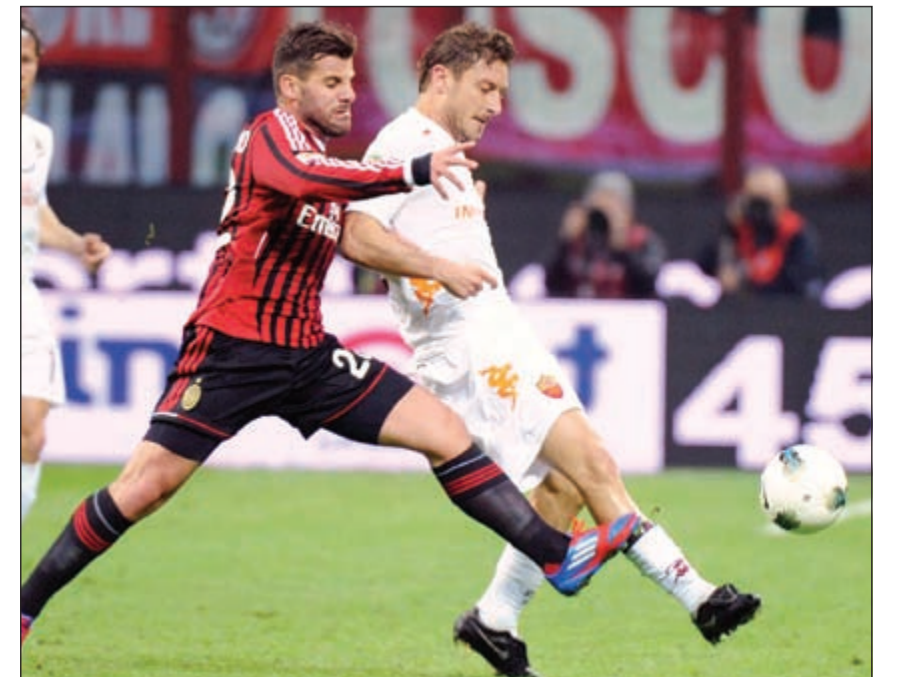
صراع على الكرة بين انطونيو لاعب ميلان وتوتي قائد روما في لقاء سابق