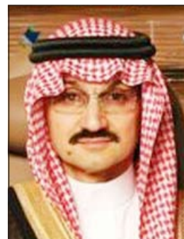
الوليد بن طلال

لاستثماراته العام الماضي، وأبرزها حصته التي تصل قيمتها إلى نحو 300 مليون دولار في شركة تويتر والتي زادت قيمتها 200٪ لدى طرح الإصدار الأولي لشركة تويتر هذا العام.