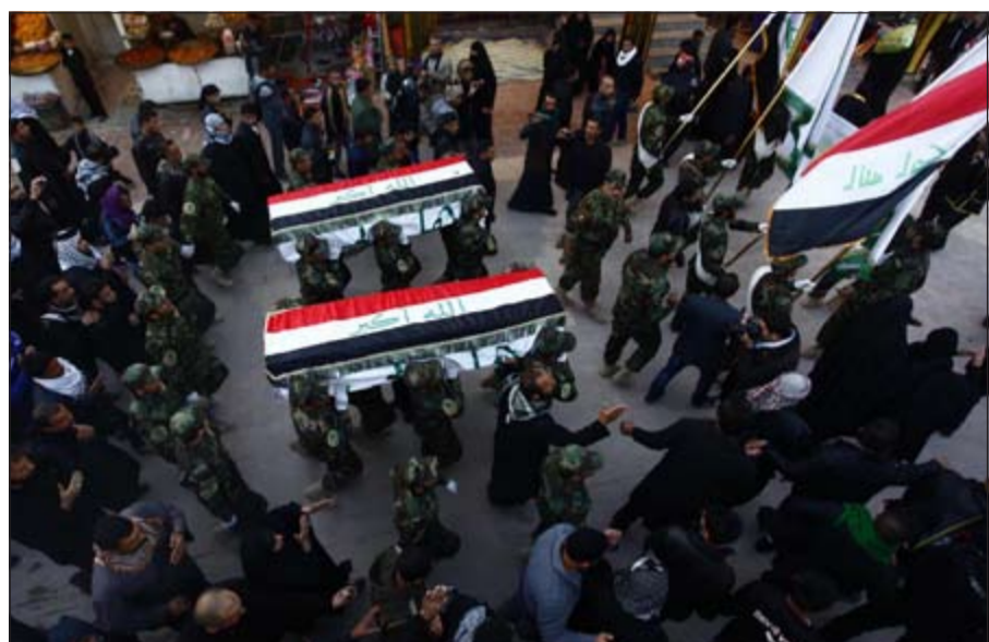
عناصر من جماعة عصاب أهل الحق الموالية للرئيس بشار الأسد يشيعون في التجف زملاء لهم قتلوا في سورية (رويترز)

والقوميات وكدولة علمانية يشعر الجميع براحة العيش فيها». وأشار الى أن موسكو تدعم جميع الجهود التي يبذلها الشركاء الأميركيون لإقناع الائتلاف الوطني لقوى الثورة والمعارضة السورية بالمشاركة في مؤتمر «جنيف-2» دون شروط مسبقة، ونحن بدورنا نعمل ليس فقط مع الحكومة السورية بل ومع جميع أطراف المعارضة بما فيها أجنحة جنيف نضع هذه المسألة في المقام الأول، ونقول إنه ينبغي تكوين تحالف بين الحكومة والمعارضة الوطنية ضد الإرهابيين الدلاء الذين تقاطروا من جميع أنحاء العالم إلى سورية، بوصفها كعكة شبيهة، لتنفيذ مخططاتهم الشريرة». وأضاف الوزير الروسي: «في سورية تتبلور حاليا الظروف التي بات على جميع الوطنيين السوريين في ظلها أن يدركوا ما الأهم بالنسبة لهم، هل هو القتال إلى جانب أولئك الذين يريدون أن يحولوا سورية إلى خلافة، أم أن يتحدوا ويعيدوا لوطنهم شكله الذي كان يفخر به على مدى عقود كبلد متعدد الديانات