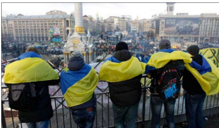
أوكرانيون مؤيدون للانضمام مع الاتحاد الأوروبي يلتحفون علم بلادهم أثناء مطلعهم لبيان الاستقلال بكيفيف

كيبف - وكالات: تجمع عدة آلاف من مؤيدي الرئيس الأوكراني فيكتور يانوكوفيتش في كيبف، أمس، حيث يخططون لمظاهرات تستمر يومين جاء ذلك عادة فشل الحوار الوطني بين السلطة والمعارضة الأوكرانية، فيما تتواصل تظاهرات المعارضة في ميدان «الاستقلال»، استعداداً لمظاهرة حاشدة اليوم ضد تحول سياسة بلاهم من أوروبا إلى روسيا، فيما قال الرئيس الأوكراني فيكتور يانوكوفيتش كلا من عمدة كيبف الكسندر بوبوف