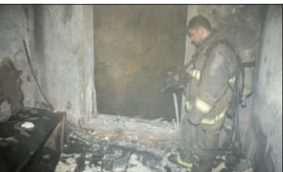
الحريق خلف اضرارا مادية

ذكرت إدارة الإعلام الأمني بوزارة الداخلية في توضيح لها على ما ورد ببعض وسائل الإعلام وعدد من مواقع التواصل الاجتماعي من روايات مختلفة بشأن قضية القتل والتي راحت ضحيتها امرأة من الجنسية الإيرانية والمتهم فيها زوجها بعدما قام بضربها بالكمة حادة نتيجة خلافات عائلية أدت إلى وفاتها. وأشارت إدارة الإعلام الأمني بأن تلك الجريمة والتي حدثت مساء أول من أمس وراحت ضحيتها امرأة إيرانية تكمن في وجود خلافات عائلية مع زوجها قام على إثرها بقتلها بالكمة