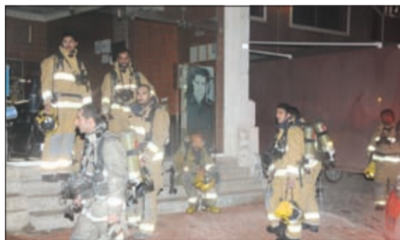
رجال الاطفاء بعد الانتهاء من التعامل مع الحريق