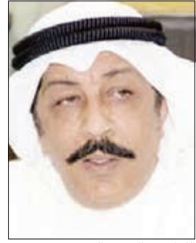
اللواء عبدالحميد العوضي

أخضع مواطن في العقد الثالث من عمره لتحقيقات مكثفة من قبل مدير عام الإدارة العامة للمباحث الجنائية للوقوف على السر الغامض والذي يسببه اقدم على قتل صديقه بطلقتين واحرق جثته عمدا بأن سكب البنزين على الجثة بعد مقتلها فيما رجحت مصادر أمنية ان يكون الانتقام وراء هذه الجريمة البشعة والتي شهدتها منطقة بر الوفرة قبل ان يأتي يوم جديد وبذلك يكون امس الأول الجمعة شهد جريمتين الأولى أودت بحياة زوجة إيرانية والأخرى أنهت حياة شاب في مقتبل العمر.