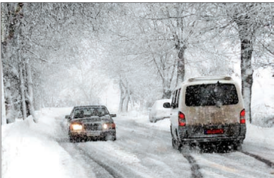
الكسا في بيروت

سكان مناطق شمال المملكة، وهي تبوك، والجوف، والحدود الشمالية، وحائل، حتى منطقة القصيم «وسط المملكة» من تأثرها بكتلة هوائية شديدة البرودة، تصل معها درجات الحرارة إلى ما دون الصفر.