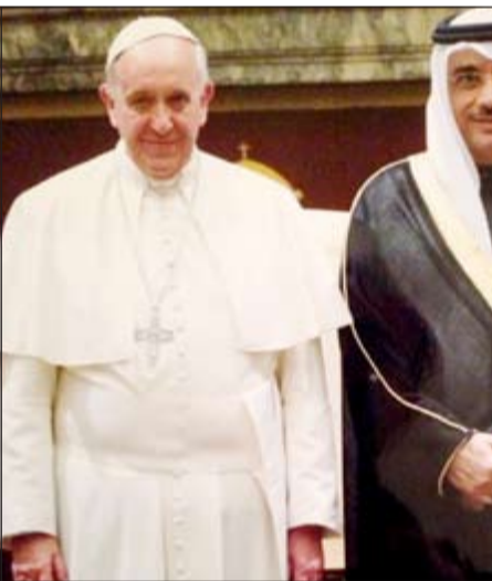
البابا فرانسيس الأول مستقبلا السفير بدر التنيب

مدينة القاتيكان (روما) - كونا: أعرب البابا فرانسيس الأول بابا القاتيكان أمس عن تقديره للسور الذي تؤديه الكويت بقيادة صاحب السمو الأمير الشيخ صباح الاحمد في ترسيخ الحوار والسلام والتضامن الإنساني. جاء ذلك خلال لقائه سفيرنا لدى الاتحاد السويسي المحال السي القاتيكان بدر صالح التنيب وعددا من السفراء الجدد في قاعة كليمنتينا بالقصر الرسولي حيث قدموا له أوراق اعتمادهم سفراء جدد لدى القاتيكان. وقال السفير التنيب في تصريح لـ «كونا» إنه تلقى البابا فرانسيس الأول رسالة من صاحب السمو الأمير صباح الاحمد تتصل بالعلاقات الثنائية وتقدير الكويت لجهود البابا في الحز على الخير والدعوة لاشاعة روح المحبة والتقارب والتعايش بين الناس ومناصرة الحق والعدل. وأضاف ان البابا أشاد بعمق العلاقات «المتميزة» التي تربط القاتيكان بالكويت والتعاون المثمر الذي يعود إلى أكثر من أربعة عقود. وتكر ان البابا حملته خلال اللقاء نقل تحياته «الحارة» إلى صاحب السمو الأمير، متمنيا لسموه دوام الصحة والعافية وللكويت وشعبها دوام التقدم والرفاهية والازدهار. وفي هذا السياق أشاد السفير التنيب بمناصرة العلاقات