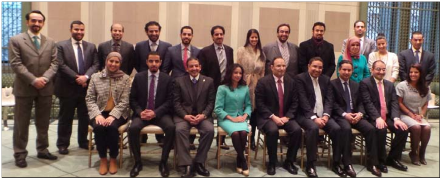
مندوبنا الدائم لدى الأمم المتحدة السفير منصور العتيبي يتوسط أعضاء الوفد الدائم والوفد المشارك في الدورة الـ 68 للجمعية العامة للأمم المتحدة

تلقي صاحب السمو الأمير الشيخ صباح الاحمد برقية شكر من أخيه صاحب السمو الشيخ محمد بن راشد آل مكتوم نائب رئيس الدولة رئيس مجلس الوزراء حاكم دبي في دولة الإمارات العربية المتحدة الشقيقة عبر فيها سموه عن خالص شكره وعظيم امتنانه وبالغ تقديره على ما حظي به سموه والوفد المرافق من كرم الضيافة وحسن الاستقبال خلال مشاركته في الدورة الرابعة والثلاثين لمجلس التعاون لدول الخليج العربية، نيابة عن صاحب السمو الشيخ خليفة بن زايد آل نهيان رئيس دولة الامارات العربية المتحدة الشقيقة سائلا سموه المولى تعالى التوفيق للجميع لتحقيق ما تصبو إليه شعوب دول المجلس من تقدم وازدهار وأن يديم على صاحب السمو الأمير موفور الصحة والعافية. هذا، وقد بعث صاحب السمو الأمير الشيخ صباح الاحمد ببرقية شكر جوابية إلى أخيه صاحب السمو الشيخ محمد بن راشد آل مكتوم نائب رئيس الدولة رئيس مجلس الوزراء حاكم دبي في دولة الامارات العربية المتحدة الشقيقة ضمنها سموه وافر شكره وتقديره