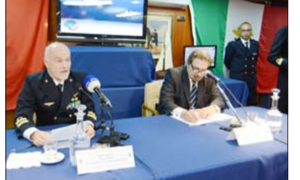
قائد المجموعة البحرية الإيطالية الاميرال باولو تريو أثناء المؤتمر الصحافي

أكد قائد المجموعة البحرية الإيطالية الاميرال باولو تريو حرص سلاح البحرية الإيطالي على مواصلة التعاون المتميز وتعزيزه مع سلاح البحرية في الكويت بما يصب في صالح البلدين والشعبين. وقال تريو قائد المجموعة البحرية الإيطالية في 30 بالبحرية الإيطالية في مؤتمر صحافي بمناسبة وصول حاملة الطائرات الإيطالية (كافور) إلى الكويت «إن ثمة رابطة خاصة تجمع بلدينا ويمثل وجود المجموعة البحرية 30 بالإضافة إلى حاملة الطائرات لبلدا واضحا على احترام إيطاليا وتقديرها وحرصها على صداقة الشعب الكويتي». وأضاف تريو من على متن سفينة القيادة والدعم اللوجستي (إيتانا) المرافقة للمجموعة في اطار جولتها الخليجية والأفريقية