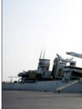
حاملة الطائرات الإيطالية «كافور»

«أن مجموعة السفن غادرت إيطاليا منتصف نوفمبر الماضي وعبرت قناة السويس مرورا بالبحر الأحمر وخليج عدن والمحيط الهندي وخليج العربي وستختتم رحلتها بالطواف على عدد من الموانئ الأفريقية». ولفت إلى ان «الحملة تعد مبادرة قوية وطموحة تخدم عددا من الأهداف نرغب في تحقيقها والاستفادة من مفهوم الاستخدام المزدوج لسفن البحرية الإيطالية»، مبينا أن «الهدف الذي تسعى البحرية الإيطالية لإنجازه هو تدريب الأطقم على العمل في مختلف الأجواء وفي مياه مفتوحة مع إمكانية الاستفادة من مناطق التدريب المميزة على طول الرحلة». وأضاف أن «من بين الأهداف الأخرى للمهمة أيضا توفير عوامل الردع والاستفادة