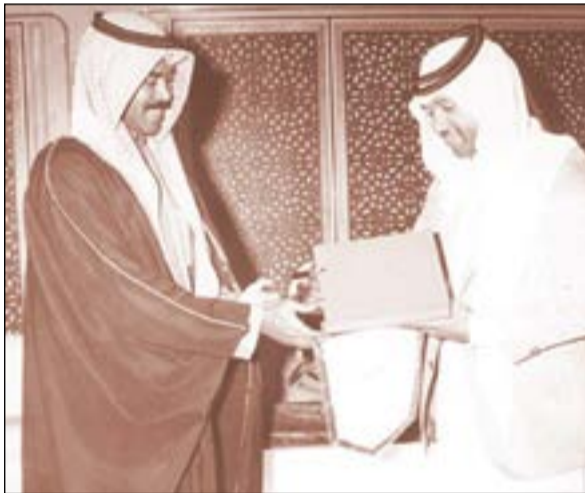
..ويتسلم درعاً تكريمية في إحدى المناسبات