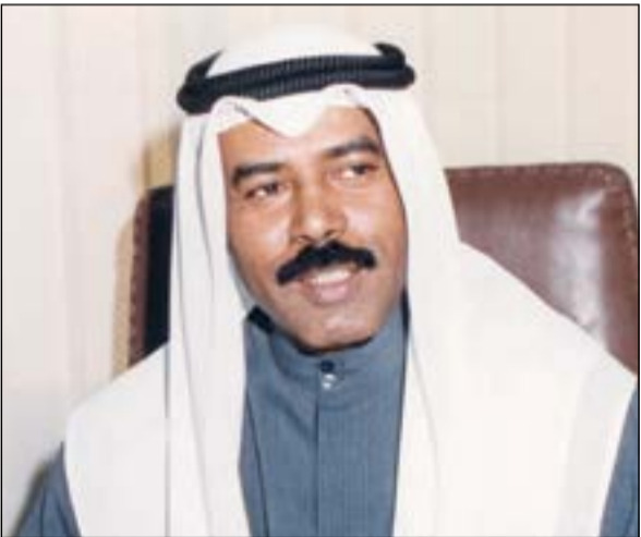
المغفور له بإذن الله الشيخ نايف جابر الأحمد

وأضاف نفاع أن المرحوم كان صاحب يد بيضاء على الجميع سواء في الرياضة أو خارجها، مشيراً إلى أنه كان محبوباً من الجميع وخير دليل الحضور الكبير الذي جاء لتشييعه عصر أمس.