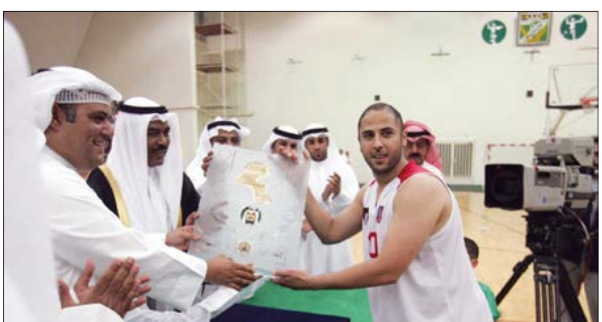
المرحوم الشيخ نايف جابر الأحمد يتوج سلة نادي الكويت

حافظ: كان متواضعاً من جهته، قال حارس العربي السابق عبدالله النجدي حافظ أنه كان أحد اللاعبين الذين لعبوا مع الراحل في المراحل السنوية للعربي وتحديداً في سن تحت 18 سنة إلا أن مهارة الشيخ نايف جابر الأحمد الهجومية أملتته للعب مع الفريق الأول بصورة سريعة وتائق كثيراً وسجل العديد من الأهداف، لكن كثرة الإصابات وتكرارها جعلته