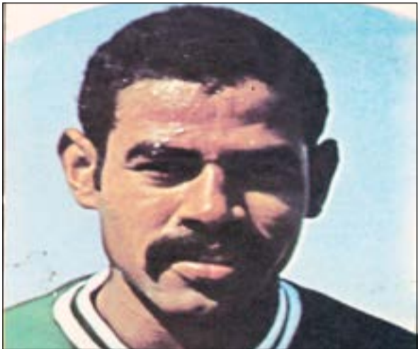
الإصابات المتكررة منعه من مواصلة اللعب مع العربي