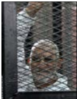
..والمرشد العام

القاهرة - أ.ش.أ: قال عمرو موسى رئيس لجنة الخمسين إن مشروع الدستور الجديد ينطوي على ضمانات غير مسبوقة للحريات والديمقراطية، بيد أنه أعتقد قانون التظاهر الجديد. وأوضح موسى - في مقابلة صحافية نقلتها شبكة «إيه بي سي نيوز» الأميركية - أنه متفائل بشأن مستقبل البلاد، قائلا إن مشروع الدستور الجديد يلبي متطلبات القرن الحادي والعشرين، وأنه واضح جدا فيما يتعلق بالديمقراطية والحريات. وردا على الانتقادات الموجهة لمشروع الدستور الجديد في المواد التي تمنح امتيازات للجيش بالسماح له بأن يختار مرشحه لمنصب وزير الدفاع والسماح بالمحاكمات العسكرية للمدنيين، أضاف موسى إن الجيش يستحق هذه السلطات، وأن هذه الخصوصيات التي منحت للجيش تعد في مصلحة الأمة في هذه المرحلة. وأوضح أن «القوات المسلحة تحظى باحترام واسع النطاق، وهي الآن تتعرض لهجوم رغم أنها تفقد العديد من جنودها وضباطها يوميا، وهناك إجماع على أننا مقبلون على ظروف غاية في الخطورة، والجيش حاليا يتعرض لهجوم ويجب علينا