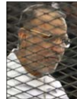
..والعريان أثناء المحاكمة