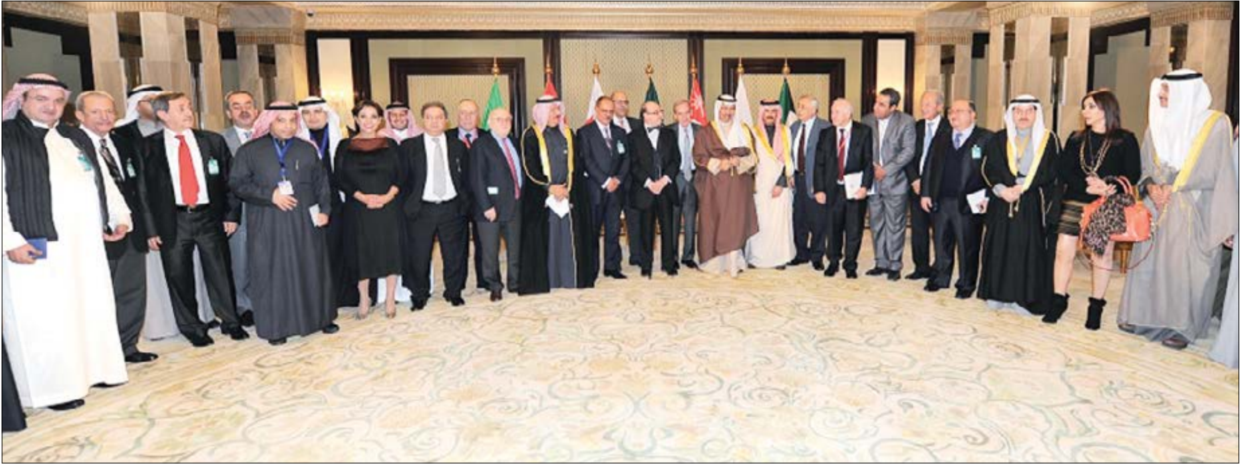
سمو رئيس مجلس الوزراء الشيخ جابر المبارك متوسماً بمجموعة من الكتاب والصحافيين