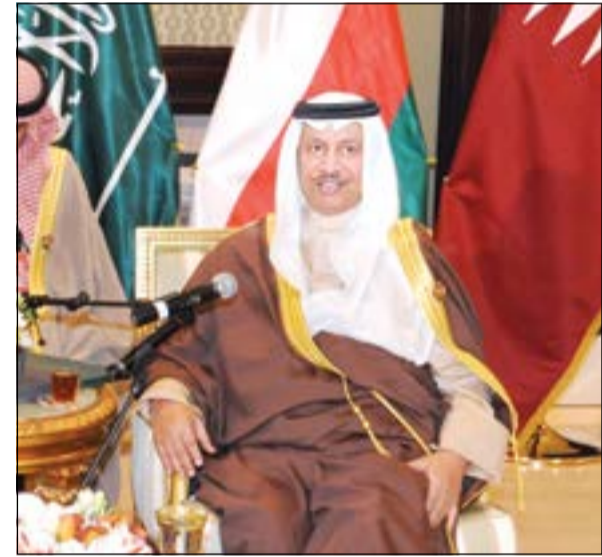
سمو الشيخ جابر المبارك متحدثا خلال اللقاء

دور في تقريب وجهات النظر بين ايران والسعودية، أبدى المبارك استعدادا وترحيب الكويت للقيام بمثل هذا الدور في حال وجود قبول من قبل الأطراف المعنية. وحول اتباع تقليد جديد في القمة الخليجية الحالية يتمثل بالقاء رئيس مجلس الأمة مرزوق الغانم كلمة في الجلسة الافتتاحية للقمة، أكد انه تمت الموافقة من قبل الجميع على هذا الأمر، معتبرا ان هذا التقليد «خطوة حميدة ونأمل لها الاستمرار في القمم المقبلة لأنها تعبر عن رغبات شعوب دول المجلس التي لا تختلف عن توجهات القادة».