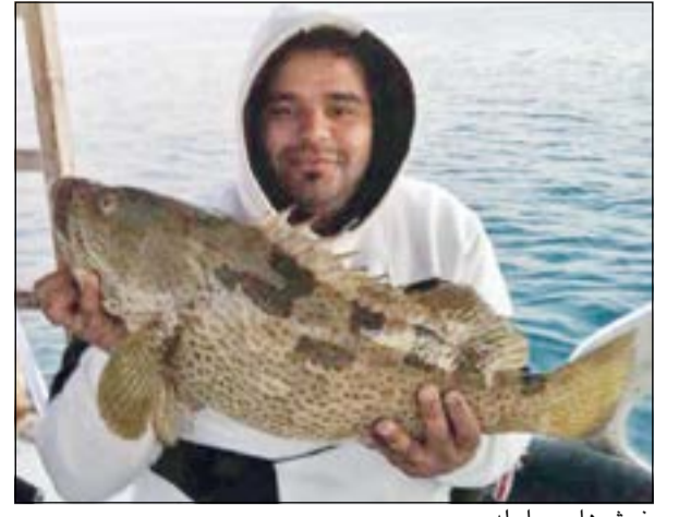
خوش هامور يا ولد