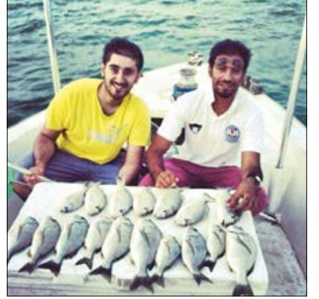
شعومنا ما عليها كلام