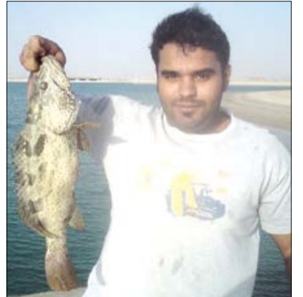
تسلم يمينك على البالول