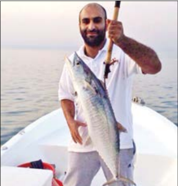
جندع يا شباب

● دعوتي الأخيرة الى كل اخواني الحداق أرجو منهم المحافظة على بحرنا وعدم رمي العلب والأكياس الفارغة به والاهتمام بعذة السلامة والإسعافات الأولية كاملة دون نقصان، وفي الختام ربي يحفظ كل مرتادي البحر ويرجعهم سالمين وطراهم فيه سمك.