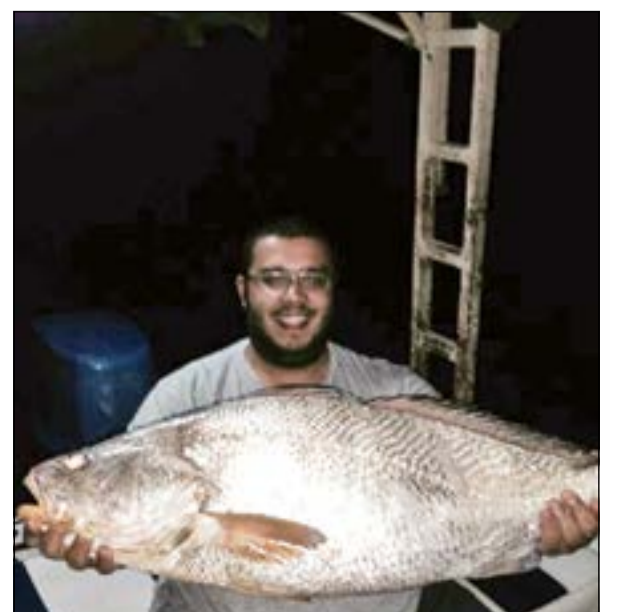
إذا قالوك شماهي.. ترى هذا هو