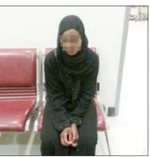
التهمة بعد القبض عليها

مصدر جمركي ان اثيوبية تعمل خادمة كانت على متن رحلة قادمة من اديس ابابا متوجهة الى المنامة (ترانزيت) لتكمل وصولها الى الكويت حتى تعود الى عملها كخادمة عند إحدى العائلات الكويتية، وعند وصولها الى مطار الكويت الدولي ولحظة وصولها الى الجمارك تحديدا، اشتبهت إحدى المفتشات الجمركية في تلك الخادمة وقامت