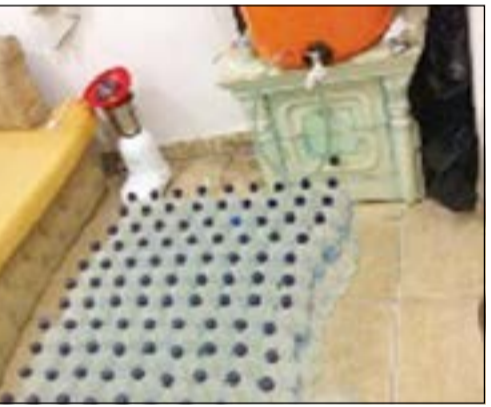
جانب من الخمر المضبوطة

برققته آخر من نفس الجنسية، وحين طلب رجال الأمن من سائق السيارة التوقف لم يستجب لهم، حيث لاذا بالهروب وقد تمت مطاردتهما حتى وصولهما لإحدى البنيات، وقد قام رجال الأمن بمطاردتهما على الأقدام وقد دخلا إحدى الشقق لينكشف القناع عن مصنع للخمر المحلية في تلك الشقة وقد تم ضبطهما المخدرات.