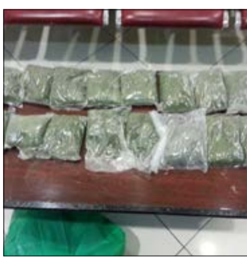
القات بعد اخراجه من امتعة الوافدة

مصدر جمركي ان اثيوبية تعمل خادمة كانت على متن رحلة قادمة من اديس ابابا متوجهة الى المنامة (ترانزيت) لتكمل وصولها الى الكويت حتى تعود الى عملها كخادمة عند إحدى العائلات الكويتية، وعند وصولها الى مطار الكويت الدولي ولحظة وصولها الى الجمارك تحديدا، اشتبهت إحدى المفتشات الجمركية في تلك الخادمة وقامت