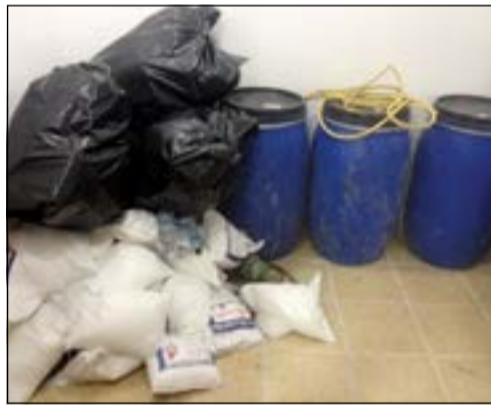
ادوات التصنيع ومعداتها

برققته آخر من نفس الجنسية، وحين طلب رجال الأمن من سائق السيارة التوقف لم يستجب لهم، حيث لاذا بالهروب وقد تمت مطاردتهما حتى وصولهما لإحدى البنيات، وقد قام رجال الأمن بمطاردتهما على الأقدام وقد دخلا إحدى الشقق لينكشف القناع عن مصنع للخمر المحلية في تلك الشقة وقد تم ضبطهما المخدرات.