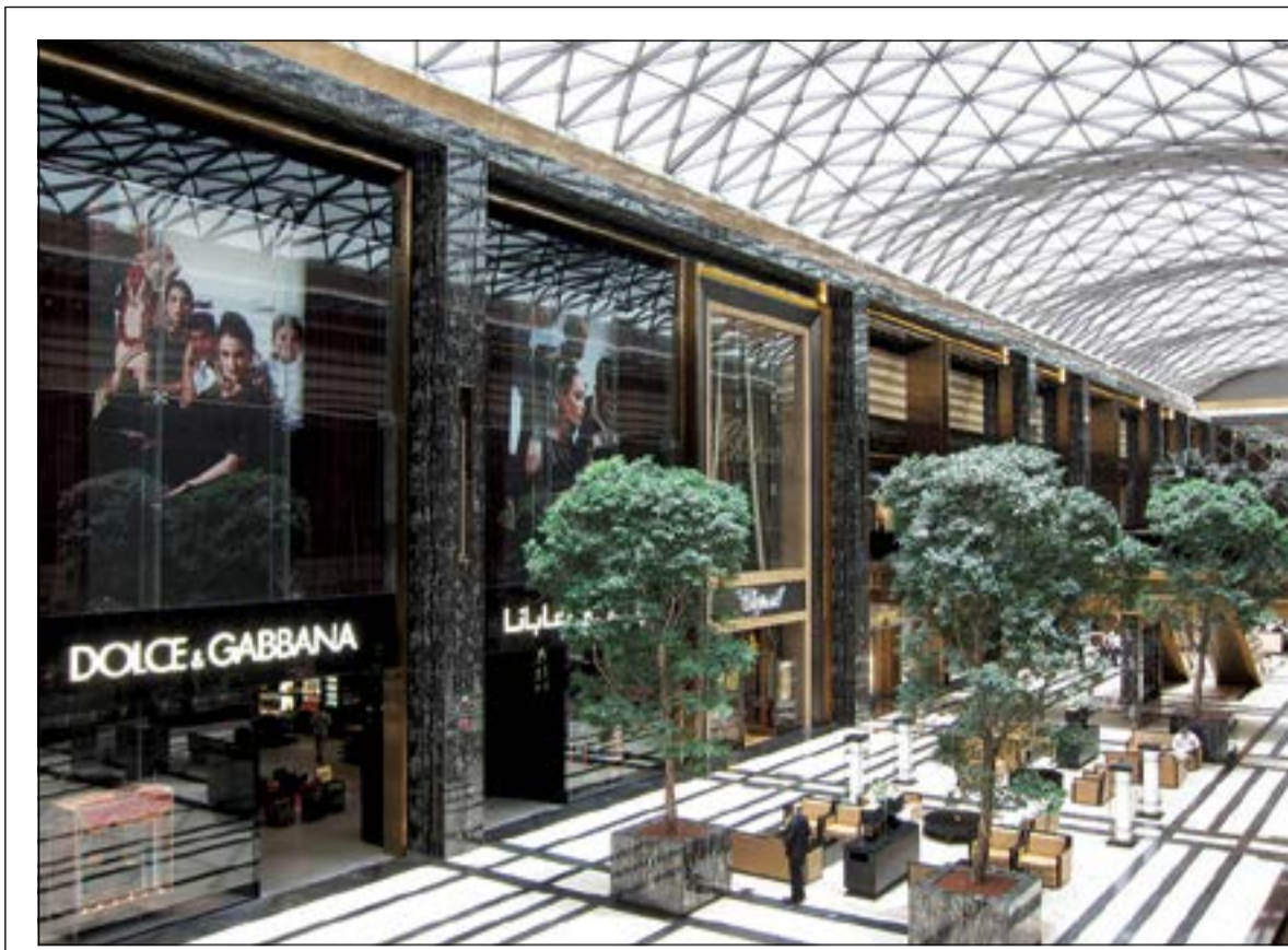
منطقة برستيج عنوان الفخامة والأناقة تحضن قريبا متجر بولغاري

كما يحرص البنك الوطني على تقديم سلسلة من الدورات التدريبية والبرامج الأكاديمية المحترفة باعتباره من رواد المؤسسات المصرفية في المنطقة في تبني برامج تدريبية للموظفين، ويلتزم البنك الوطني بدعم الشباب الكويتي والعمالة الوطنية كأحد أكبر الجهات توظيفا في القطاع الخاص. ويمكن للراغبين في الالتحاق بالعمل في البنك الوطني تقديم طلباتهم من خلال careers@nbk.com أو زيارة ادارة الموارد البشرية في مبنى البنك الوطني الرئيسي الثاني.