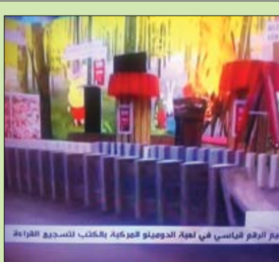
..ويستمر مسلسل البدييات