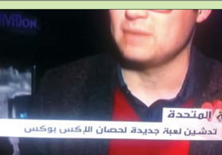
«حصان» بدلا من «جهان»