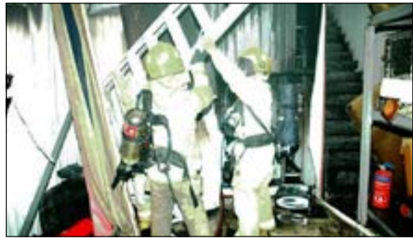
رجال الاطفاء بعد الانتهاء من اخماد الحريق