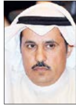
العميد صالح الغنم

مكافحة المخدرات من تحريات أفاد بأن الكمية التي بحوزته تخصه بقصد الاتجار وبسؤاله عن مصدرها أفاد بأنه تحصل عليها من شخص لا يعرف، بياناته كاملة وجار البحث عنه، وتمت إحالة التهم والمضبوطات إلى جهات الاختصاص لاتخاذ الإجراءات القانونية اللازمة.