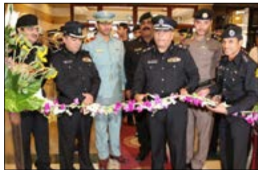
اللواء خالد الدين خلال الافتتاح

من جانبه قام رئيس جمعية بشائر الخير الشيخ عبدالحميد البلالي بشرح عن نشاط الجمعية ودورها في علاج الإدمان وتأهيل المدمنين، مشيراً إلى ما أثمرته أنشطتها من خير، وبأن هذه التجربة الرائدة تعد الأولى في العالم العربي والإسلامي، حيث بدأت الفكرة تنمى على أرض الكويت وأينعت ثمارها، مؤكداً أن الجمعية تقدم خدمة إنسانية لكل البشر أينما وجدوا لتحقيق هدف نبيل وهو إنقاذ المجتمع من آفة المخدرات الفتالة.