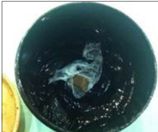
الحشيش المخبأ داخل علبه «الجل»