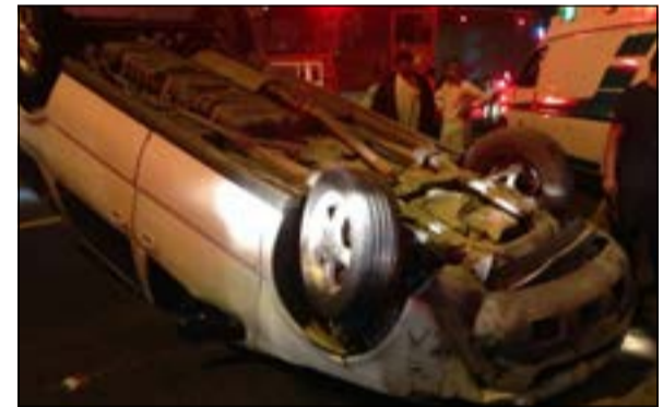
المركبة المنقلبة وسيارة الاسعاف تبدو حاضرة