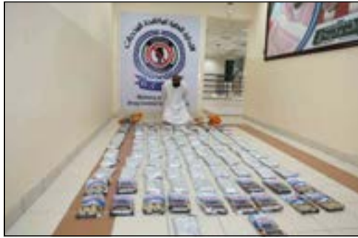
التهم وأمامه المضبوطات