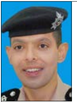
العقيد عادل الحشاش

وكذلك طريق الملك فيصل القادم من المدينة مقابل منطقة خيطان وتحويل المسار إلى الوازي المؤدي إلى جسر نادي خيطان، وبعض الطرق الأخرى المؤدية إلى خطوط سير الموكب وذلك خلال مواعيد الاستقبال الرسمي يوم غد 10 ديسمبر 2013 من الساعة 12 ظهراً إلى 2 بعد الظهر. وأكد على تكامل الخطة الأمنية المرورية ومحاورها المختلفة وتحقيق أعلى درجة من درجات التنسيق والتعاون بين أجهزة الأمن في جميع قطاعات وزارة الداخلية المعنية والتأكد من عدم وجود أي سلبيات وتلافي أي قصور من لجل الظهور بالظهر الحضاري المشرف واللائق بالكويت وتجسيدها لقدرتها على توفير المتطلبات الأمنية والمدنية لاستضافة أعمال تلك القمة الخليجية.