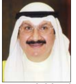
الشيخ سالم العبدالعزیز

يعقد مجلس الخدمة المدنية صباح اليوم اجتماعاً برئاسة نائب رئيس الوزراء ووزير المالية الشيخ سالم العبدالعزیز لبحث وإقرار عدة قضايا مطروحة على جدول أعمال المجلس.