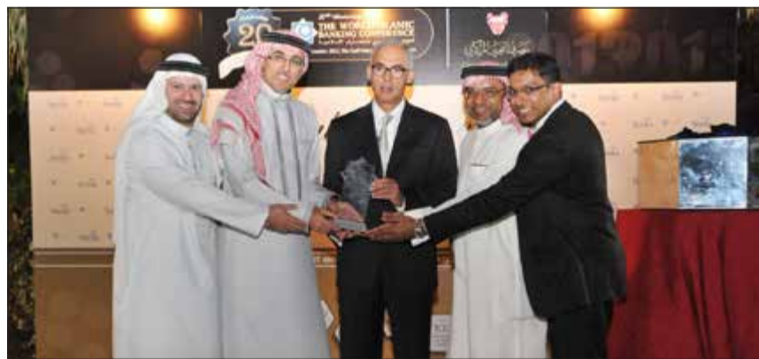
الخياط يتسلم الجائزة