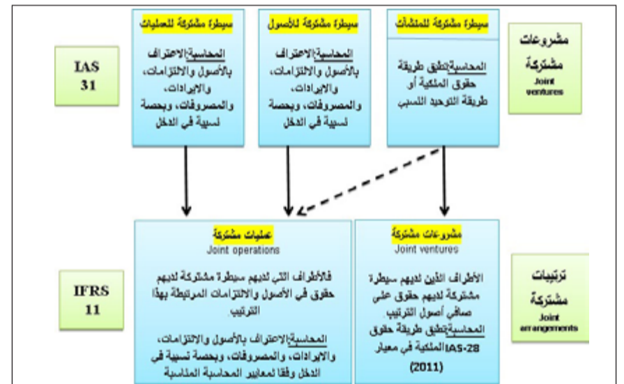
مقارنة بين المعيار القديم والمعيار الجديد