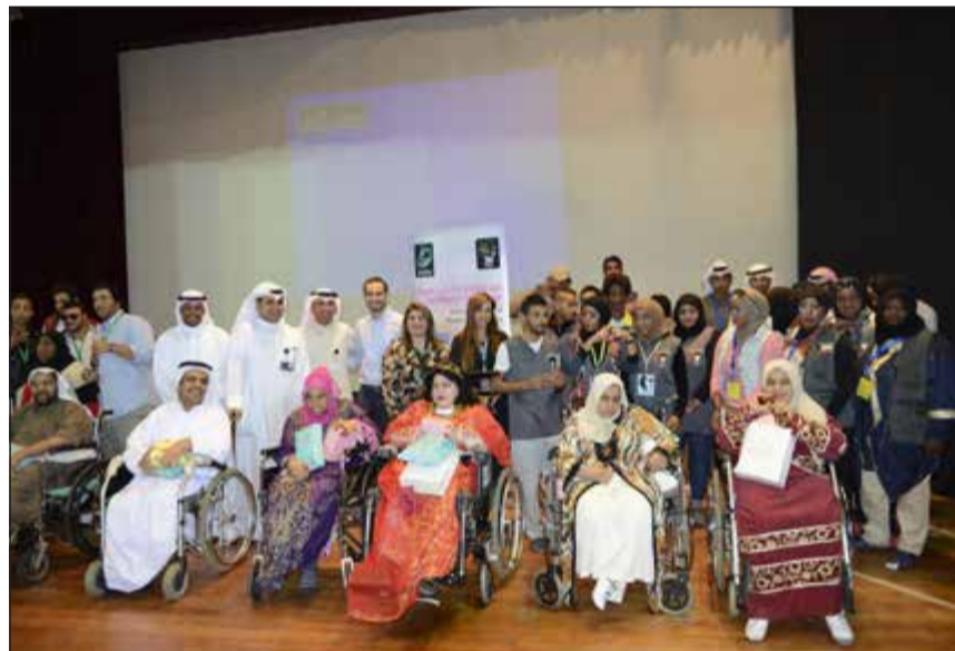
ذوو الاحتياجات الخاصة يعبرون عن فرحتهم مع «زين»

شاركت «زين» في الاحتفال الخاص باليوم العالمي لذوي الاحتياجات الخاصة بدعوة جميع عملائها لمشاركة هذه الفئة الغالية علينا جميعاً فرحتهم في الاحتفال بيومهم الذي تنظمه إدارة دور الرعاية في وزارة الشؤون الاجتماعية والعمل، تحت رعاية وزيرة الشؤون الاجتماعية والعمل د.نكري الرشيد. وأقادت الشركة في بيان صحافي بأنها احتفلت بهذا اليوم الذي خصصته الأمم المتحدة للاحتفال بذوي الاحتياجات الخاصة حول العالم انطلاقاً من دورها الاستراتيجي والمسؤولية الاجتماعية، والتي تتبناها