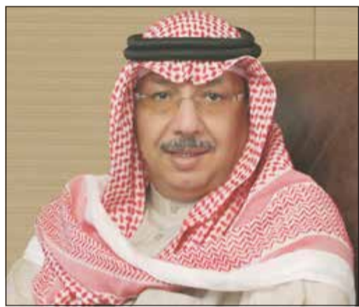
الشيخ محمد الجراح

صرح رئيس مجلس إدارة بنك الكويت الدولي الشيخ محمد الجراح الصباح بأن وكالة «فيتش» للتصنيف الائتماني قد رفعت تصنيف بنك الكويت الدولي إلى A+ مع نظرة مستقبلية مستقرة، والذي يقيس احتمال تعثر الائتمان الصادر على المدى الطويل الأجل، مع الإبقاء على النظرة المستقبلية مستقرة، كما رفعت تصنيفها لتعثر الائتمان الصادر على المدى القصير من أف 2 إلى أف 1، في حين أكدت على تصنيف b+ وفقاً لتصنيف الجدوى المالية Viability Rating. مشيراً إلى أن هذا التصنيف الجديد يعكس بلا شك متانة المركز المالي وقوة أصول البنك الجيدة، حيث حقق الدولي إنجازات ملموسة على عدة أصعدة، طالت عملياته ونتائجها المالية، وبيئته التشغيلية، ومؤشراته المستقبلية، بما في ذلك التطور التقني والبشري لكل إدارته، والتزامه بمعايير الحوكمة والشفافية. وإزاء هذا التصنيف الجديد للدولي، والتقدير العالمي الذي حظي به بنك الكويت الدولي من قبل وكالة تصنيف عالمية بحجم «Fitch Rating»، اعتبر الجراح أن حصول البنك على هذا التصنيف المتقدم هو بمنزلة تكريم