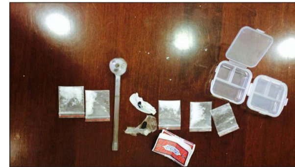
المخدرات وأدوات التعاطي المضبوطة

أحيل بدورية نجدة إلى مبنى الإدارة العامة لمكافحة