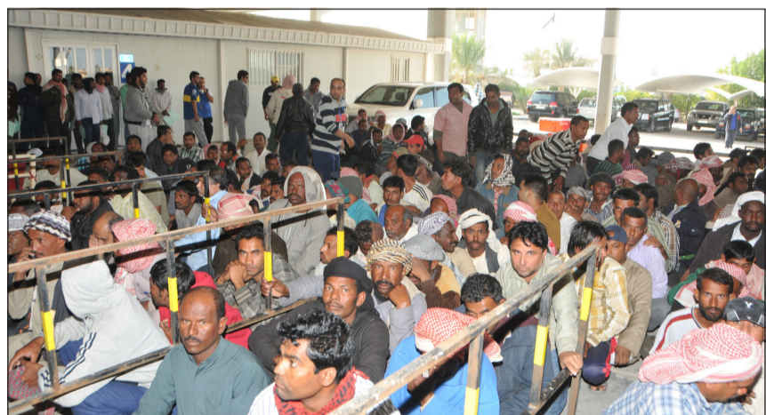
المخالفون بعد ضبطهم

ويؤكد عدد المصوبين من المخالفين على يقظة قطاع الجنسية والجوازات ومنتسبيه وعزمهم على المضي قدماً في مواجهة المشتبه بهم وتخليص المجتمع من جميع أشكال الجريمة وضبط المطلوبين للعدالة وفق الخطط والبرامج المعدة لذلك حفاظاً على أمن المجتمع وحماية لاستقراره حيث حققت الحملة أهدافها وتمكن رجال مباحث الهجرة من ضبط عدد كبير للمخالفين وخصيلة وأفرة من المشتبه بهم.