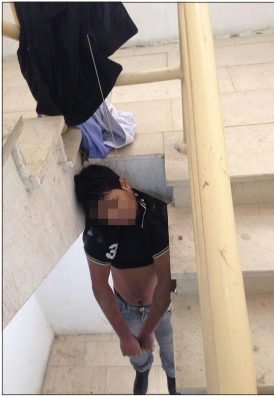
النيبالي وقد أعد «المشنقة» بشكل متقن