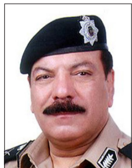
لواء عبدالفتاح العلي

وذكرت الإحصائية الصادرة أنه تم تسجيل 5685 مخالفة مرورية في نطاق محافظة العاصمة وحجز 168 مركبة وإحالة 26 أشخاص إلى نظارة المرور، بينما تم توقيع 6420 مخالفة مرورية في محافظة الفروانية وحجز 124 مركبة، وإحالة 51 شخصاً إلى النظارة. وأضافت أن محافظة حولي سجلت 9040 مخالفة