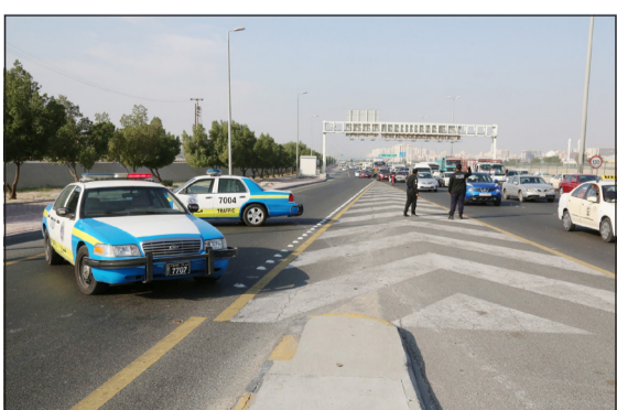
دوريات المرور تغلق إحدى الطرقات

حركة المرور من طريق صبحان القادم من الدائري السابع باتجاه طريق الملك فيصل وتحويل المسار إلى طريق الملك فهد كطريق بديل. وكذلك طريق الملك فيصل القادم من المدينة مقابل منطقة خيطان وتحويل المسار إلى الموازي المؤدي إلى جسر نادي خيطان، وبعض الطرق الأخرى المؤدية إلى خطوط سير المواكب. وأشارت إلى أن الهدف من إجراء البروفة الأمنية المرورية إتاحة الفرصة للتأكد من أداء المهام المنوطة المختلفة وتحقيق أعلى