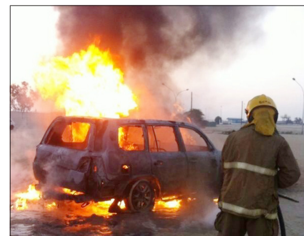
أحد رجال الإطفاء أثناء تعامله مع الحريق