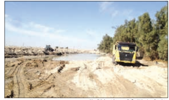
دفان البرك المائية التي خلفتها الأمطار