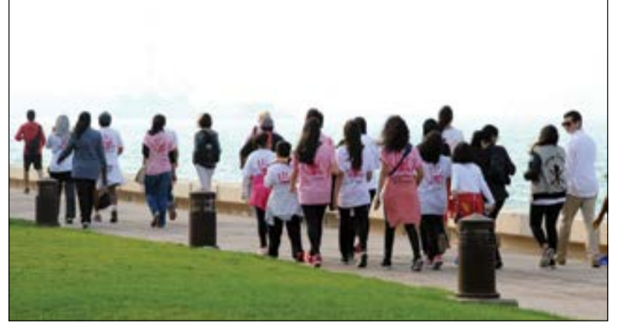
جانب من الماراثون