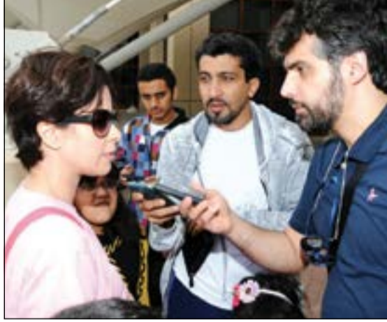
الشيخة الزين الصباح متحضنة لـ «كونا»

وقالت «اننا في بلدان الشرق الأدنى نؤمن بكفاي بلدان العالم بالأهمية القصوى للتربة ودورها الأساسي في