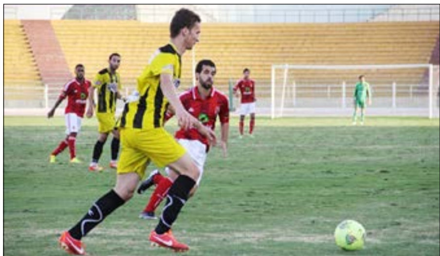
الأهلي والمقاولون في مواجهة سابقة