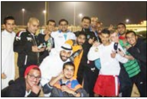
فرقة الملاكمين بالفوز

نجح لاعبو ملاكمة نادي السالمية في تحقيق المركز الاول في بطولة الرجال الاولى بمشاركة تسعة اندية خلال الفترة من 1 إلى 4 الشهر الجاري واحتل النصر والكويت المركز الثاني مكر.