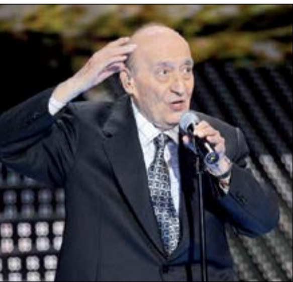
الفنان الكبير الراحل وديع الصافي

يشارك أنطوان وجورج ابنا النجم اللبناني الراحل وديع الصافي، في حفل تكريمه بدار الأوبرا المصرية، المزمعة إقامته الأحد المقبل، حيث سيقوم بإحياء الحفل المطرب المصري أحمد سعد وبعض مطربي ومطربات الأوبرا الشباب. ومن المزمع أن يتم عرض فيلم تسجيلي عن الراحل يتضمن لقطات من مشواره الفني، ومجموعة من الصور النادرة له في شبابه، وعرض أشهر أغنياته التي حققت نجاحات كبيرة على مستوى العالم العربي بأكمله. وكان الراحل قد توفي منذ شهرين عن عمر يناهز 92 عاما عقب أزمة صحية شديدة.