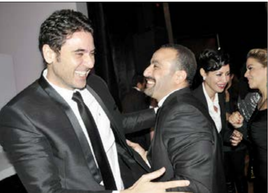
السقا وعز والمنافسة بينهما

صورة لها مع أحمد عز. يذكر ان الفنان أحمد السقا بعد ان اتفق مع المخرج أحمد شفيق والمنتج صادق صباح، على تقديم مسلسل تلفزيوني لعام 2014، اضطر للترجع عن هذا القرار، بسبب انشغاله بفيلمين دفعة واحدة، الأول مع نجم أفلام الحركة والأكشن في هوليوود جان كلود فان دام والذي سيبدأ تصويره أوائل 2014، والثاني «الجزيرة 2» الذي يستعد السقا لتصويره هذه الفترة مع المخرج شريف عرفة.