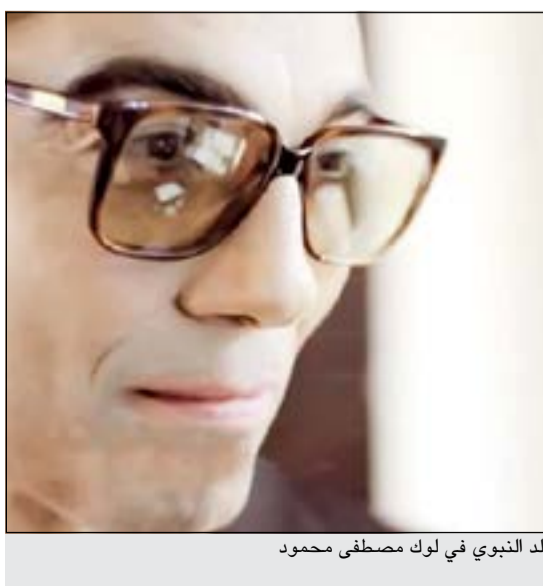
خالد النبوي في لوك مصطفى محمود