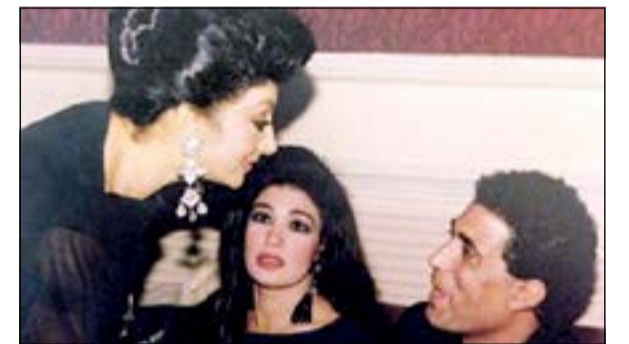
فيفي عبده وأحمد زكي ونبيلة عبيد

وبسؤال فيفي عن الصورة قالت، بحسب «اليوم السابع» المصرية: هذه الصورة تجمعني بها ذكريات سعيدة مع النجم الراحل أحمد زكي، والذي اعتبره أسطورة فنية لن تتكرر، نظراً لما يتمتع به من موهبة خاصة ومتفردة، وهو نفس الأمر بالنسبة للنجمة الكبيرة نبيلة عبيد، والتي اعتبرها من أهم نجمات السينما المصرية، ولذلك حرصت على نشرها.