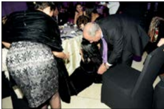
.. ومحاولة انقاذها بعد سقوطها